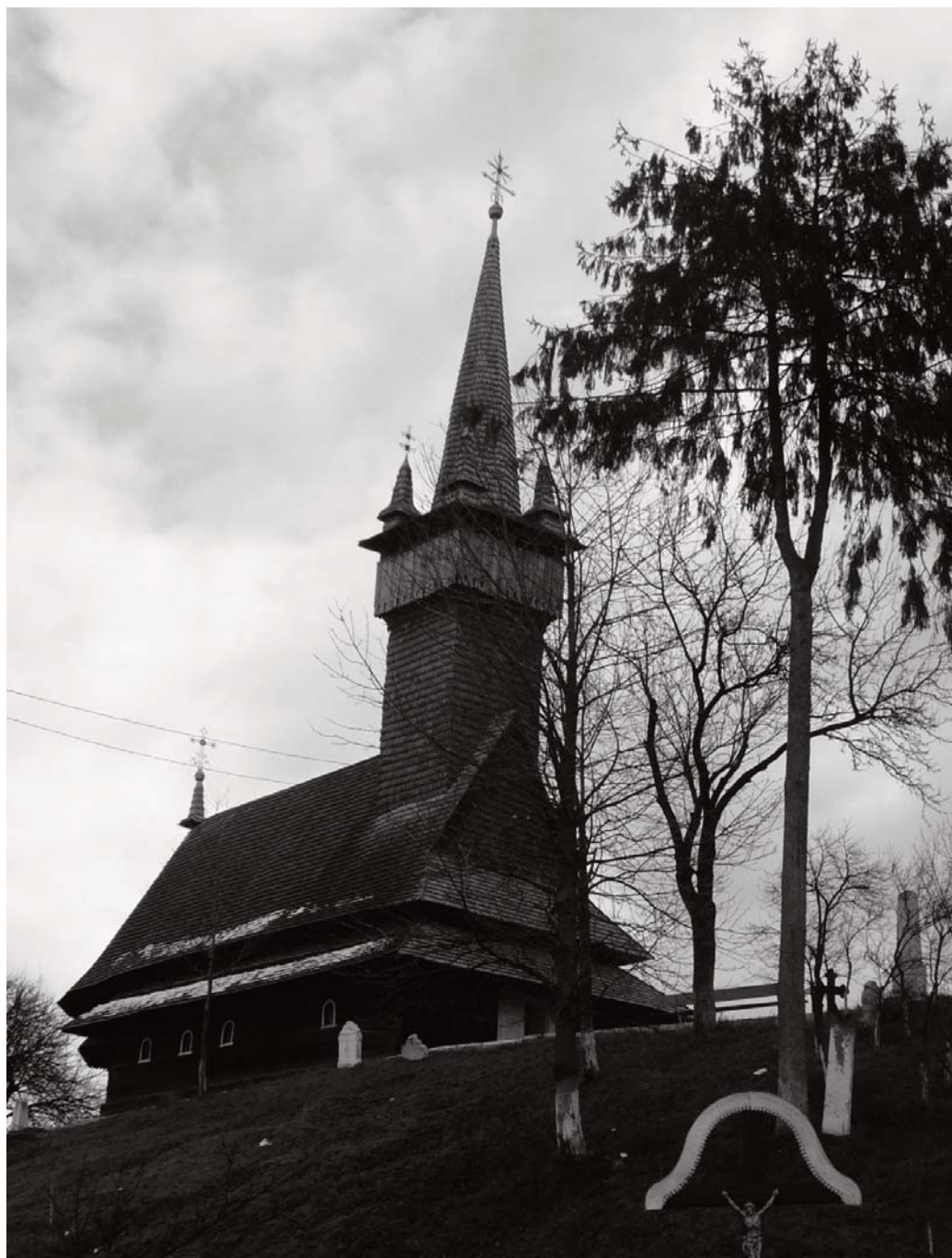
Georgeta Maria Iuga: Biserica din Așa de Jos, sec. XVI