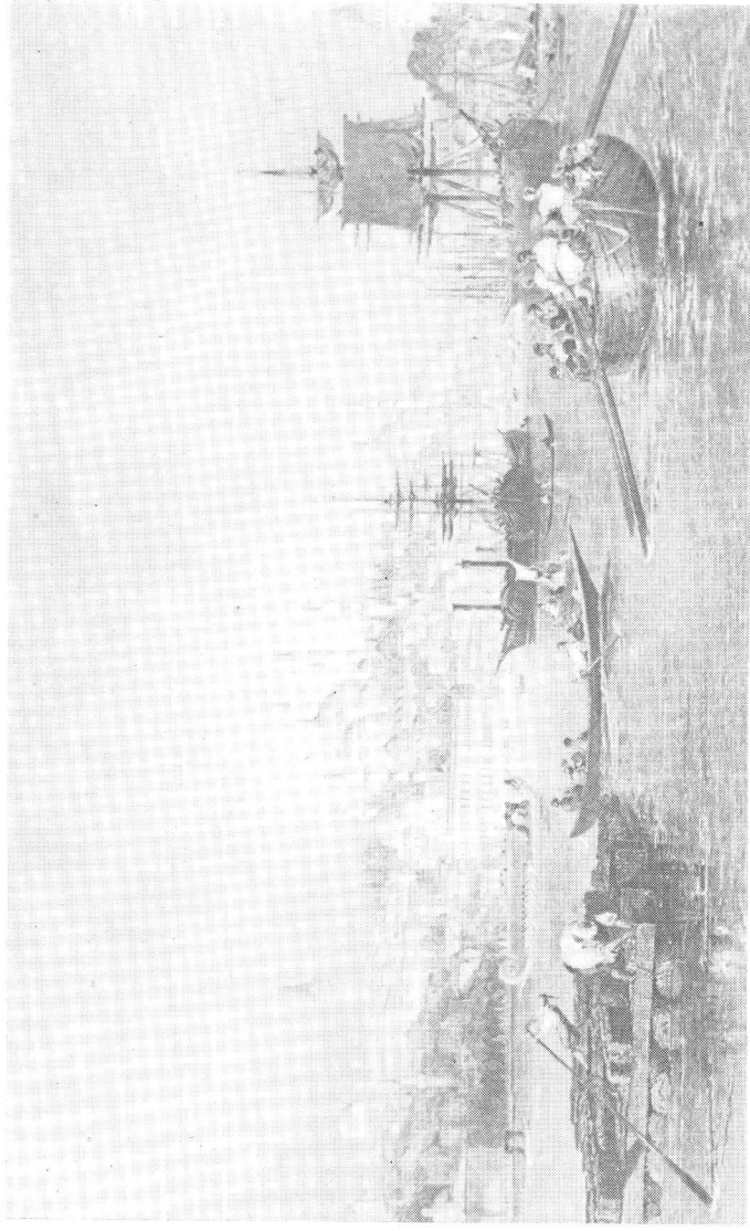
Constantinopol, privire dinspre Cornul-de-Aur (după gravura lui Th. Allom).