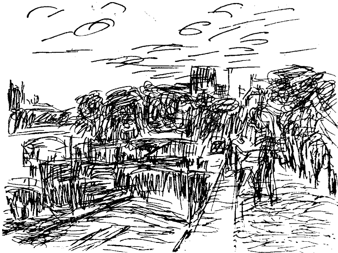
ștefan constantinescu : peisaj din paris

întunecă luciditatea criticului care, reabilitînd ceea ce merită a fi reabilitat din galeria inegală a personajelor zamfiresciene, sancționează tarele schematicismului, ale artificiei și romantismului sentimental, tot atât de caracteristice precum, în poezie, livrescul, descriptivul și, mai ales în prima parte a creației, retorismul melodramatic. Virtute cu atât mai prețioasă, alături de soliditatea și bogăția materialului biografic, cu cît metoda de lucru, studiul simultan al operei și vieții, nu favorizează, poate din contra, sporește dificultățile în calea circumscrierii locului și ierarhizării interne a literaturii lui Duiliu Zamfirescu. O monografie amplă, documentată, serioasă. Am îndrăzni să spunem exhaustivă.