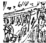
ștefan constantinescu : notre-dame.