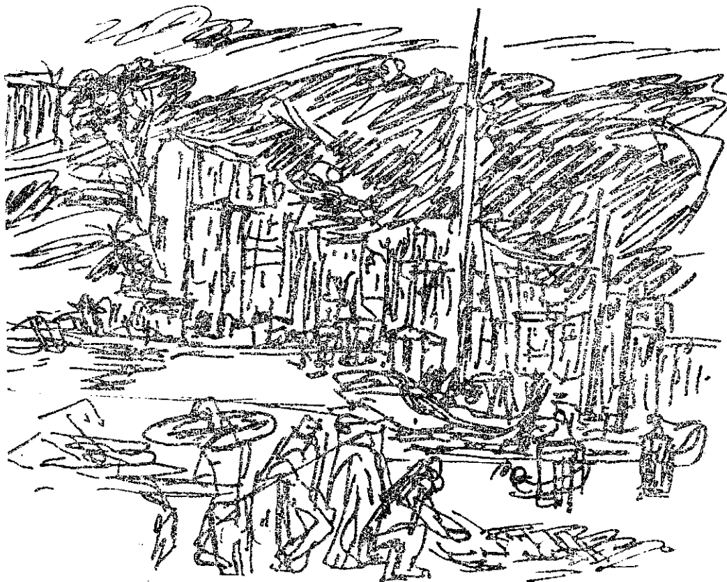
ștefan constantinescu : portul dieppe.