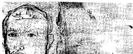
Paul Erdős: Muncitor

lui pamintesc prezintă de o bucată de vreme o caracteristică ireversibilă: imperialismul apare din ce în ce mai restrâns în aria lui. Cei patru factori de baza pe care-i enumera Nikita Hrușciov la Congresul XXII ca tot atâtea premize ale asigurării trainice a Păcii, au căpătat prin înseși dezbaterile acestui Congres epocal o dimensiune în plus: aceea a certitudinii că într-un viitor apropiat, din care primele trepte vor fi urcate chiar în decursul acestei generații, omenirea va putea vedea cu proprii ei ochi întruchiparea visului ei de aur: comunismul