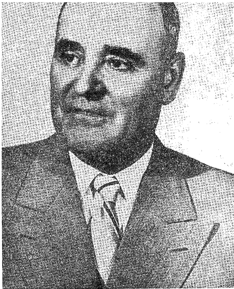
TOVARĂȘUL GHEORGHE GHEORGHIU - DEJ A ÎMPLINIT 60 DE ANI