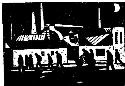
Gawil Vkev (R. P. Bulgaria) : Muncitori (gravură)

Ieri a lucit furtuna pe vîrfuri de brazi, spre noapte ploaia dulce a sunat. Albastru și neted, emailat e cerul de azi.