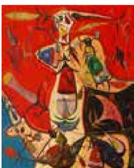
Ilustrația numărului: Ștefan Pelmuș, Eva și Inorogul , 51x41cm