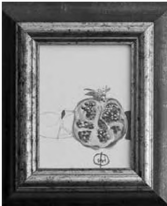
Vladimir Ene acril, pastel de ulei pe pânză

Ai mei se vede că-i știau meteahna, fiindcă îi puneau un lighean cu apă lângă pat, ca să-o facă să se trezească, atunci când aluneca din așternutul calduț. Uneori, da, i se întâmpla să-și revină brusc, și se îngrozea. Sărea iute înapoi în pat și-și trăgea plapuma până peste cap, atât cât putea,