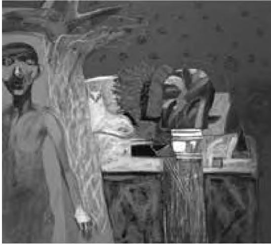
Vladimir Ene Pe înserat acril, pastel de ulei pe pânză, 90 x 100 cm

Aceeași dumnezeiască înțelepciune care conform lucrării In De divinis nominibus 15 este causa efficace (effectiva) a tuturor lucrurilor, întrucât produce în Ființa sa lucrurile și nu numai le dă ființă; în lucruri ființa este ordonată, întrucât lucrurile interacționează între ele, într-o ordine ce își are finalitatea sa ultimă. Mai mult, finalitatea este cauza validității acestei armonii și a