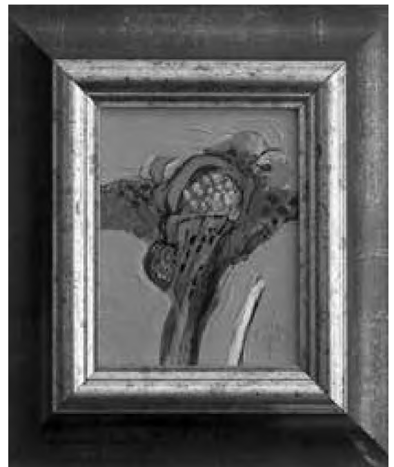
Vladimir Ene acril, pastel de ulei pe pânză