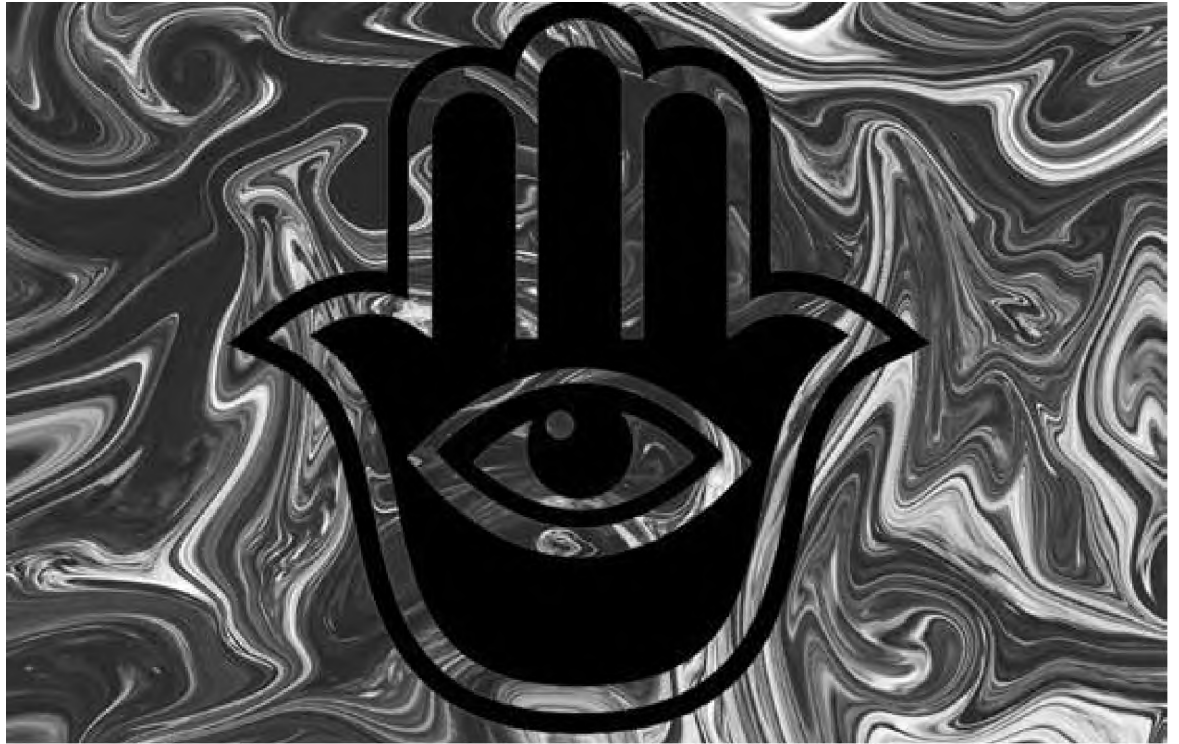
Ilustrație digitală de Mihai Dionis Barbu