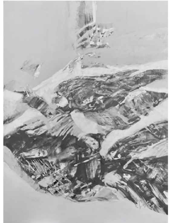
Doru Cernea tehnică mixtă, 70 x 52 cm

O formulă pentru invocarea numelor acestor îngeri sau spirite ale luminii planetare se găsește în textul de magie Picatrix (IV, VII); prin el se realizează operațiuni magice folosind oglinzi care strâng la un loc lumina. Și pentru celălalt mare filosof neoplatonic evreu Ibn Gabirol, cunoscut de latini cu numele de Avicenna, autorul unei opere care a exercitat o mare influență în filosofia medievală, Izvorul vieții , lumina este o formă a materiei,