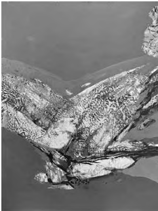
Doru Cernea Căderea în timp (2022) tehnică mixtă, 50 x 48 cm

Heidegger se arată mai curând decepționat de filosofia contemporană lui. El consideră că „filosofia devine, în formele logisticii, semanticii, antropologiei și sociologiei și psihanalizei,