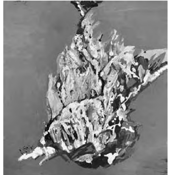
Doru Cernea tehnică mixtă, 50 x 48 cm

Marele merit al grupării alternative a haiku-urilor pe capitole, prin alăturarea poemelor scrise de cei doi, stă în faptul că poți sesiza diferențe de stil, în ciuda faptului că sunt respectate canoanele. Așa cum relevă și scriitorul Dan Norea în cele scrise pe coperta patru a cărții: „Veronica