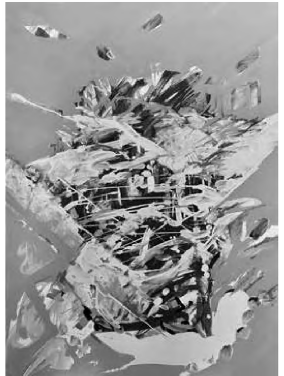
Doru Cernea tehnică mixtă, 50 x 48 cm

Ca și în nuvele, există un punct de plecare realist în comedii pirandelliene, ca utilizarea dialectului, în unele din ele, dar mai ales situațiile personajelor, mai ales că este vorba de Sicilia micilor și prăfuitelor orașe, cu o liliputană clasă de mijloc conformistă și limitată, în care oamenii spun adevărul numai punând pe cap „tichia cu clopoțel” a clovnului, adică simulând nebunia,