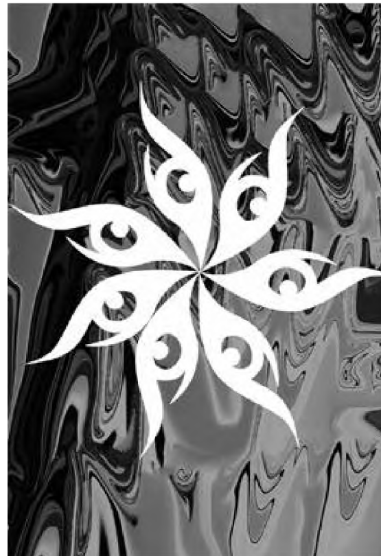
Ilustrație digitală de Mihai Dionis Barbu

sub primele stele se lamentează un havuz un papă excomunicat cineva se joacă cu bancurile de pești din bazinul de marmură dintr-un golf argintiu