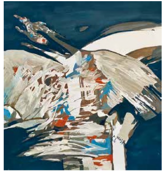
Doru Cernea Tentația zborului (2022) tehnică mixtă, 50 x 48 cm

Doru Cernea este fără echivoc de partea filosofilor și teologilor creștini care invitau să fie urmată „calea luminii”, cea anunțată de Isus: „Eu sunt Lumina lumii; cine Mă urmează pe Mine nu va umbla în întuneric, ci va avea lumina vieții.” (Ioan 8.12). Frumusețea lumii este evidentă astfel în lumina atotcuprinzătoare a