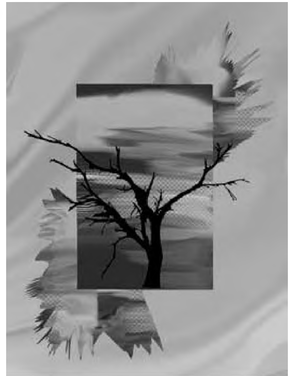
Ilustrație digitală de Mihai Dionis Barbu

regatul e în spatele ei ea însă rămîne pe țarm pînă orbește