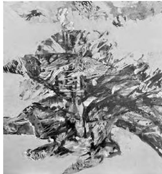
Doru Cernea tehnică mixtă, 70 x 52 cm

Una dintre cele mai mari drame ale omenirii a fost Ciuma Neagră – ea a cauzat de-a lungul anilor milioane de morți, dar și valuri de violență: în Sicilia, au fost uciși catalanii, în Europa, evreii, în Franța misionarii și cerșetorii (erau bănuți