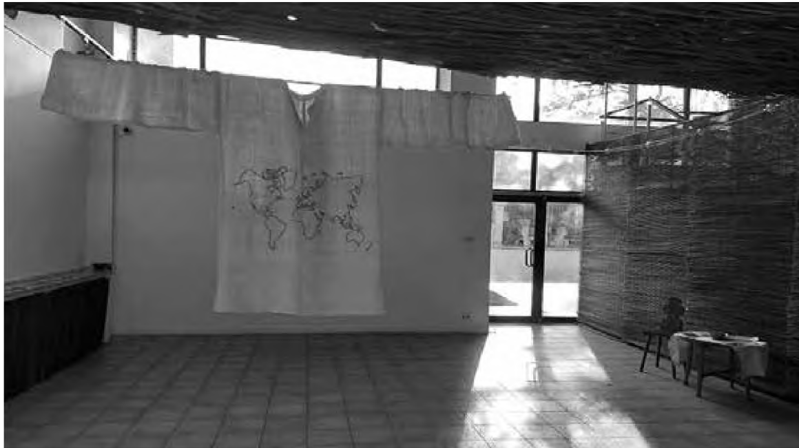
Imagine din Expoziția „Cămașa ciumei”.