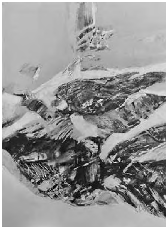
Doru Cernea tehnica mixtă, 70 x 52 cm

În această comedie-farsă este clară și dimensiunea poetică a lui Pirandello: prima fază a umorului, avertismentul contrar, și deci comedia, este expusă de personajele care întrușipează personajele burgheziei sau clasei de mijloc siciliene de atunci, ele judecând pe baza stereotipurilor impuse de societate și când văd povești care sunt diferite de tiparele lor, simt opusul a ceea ce ar trebui să fie (mama nu poate să nu-și viziteze fiica), judecata lor fiind deci condiționată de convențiile sociale. 29 Dar poetica are și un alt aspect, unul mai profund care nu se mulțumește cu ceea ce vede la suprafață, ci vrea să investigheze eul, profunzimiile subiectelor, personajul Laudisi, un fel de alter ego al autorului sau eu teatral, să-i spunem, având această funcție importantă, care nu se mulțumește cu date obiective, nu se oprește la curiozitatea și zâmbetul burgheziei, mergând mai departe. 30 În