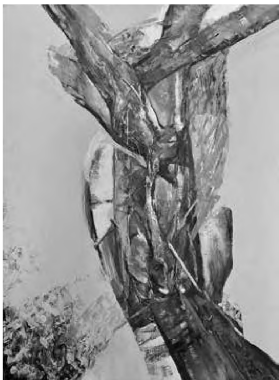
Doru Cernea tehnică mixtă, 50 x 48 cm