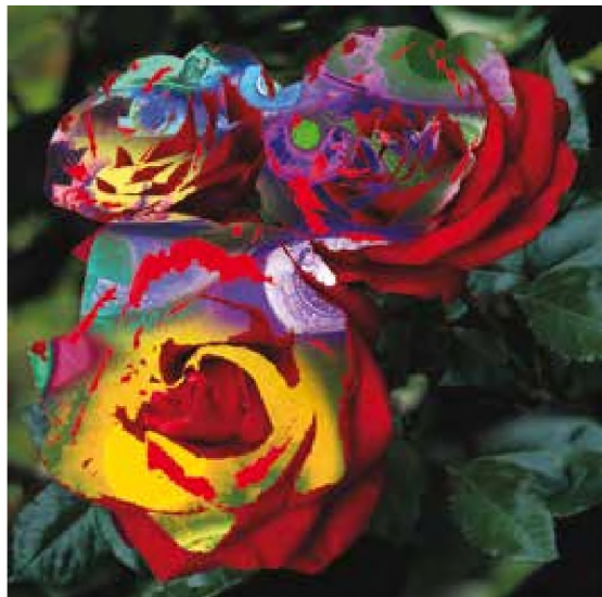
Ilustrație digitală de Mihai Dionis Barbu

Pe copertă: Doru Cernea Cruce în amurg (2018) tehnică mixtă, 70 x 52 cm