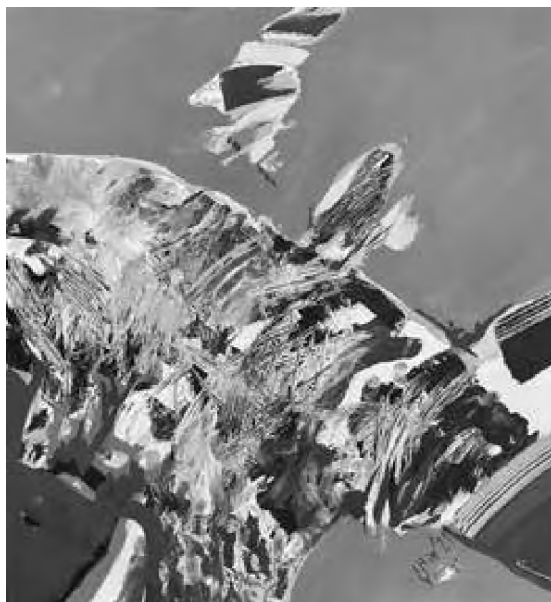
Doru Cernea tehnică mixtă, 70 x 52 cm Tărâmul făgăduinței (2022)

Jean Delay, autor în anii 50 al unui interesant studiu intitulat Névrose et création 2 , parvine la concluzia că tulburarea nevrotică se comportă ca