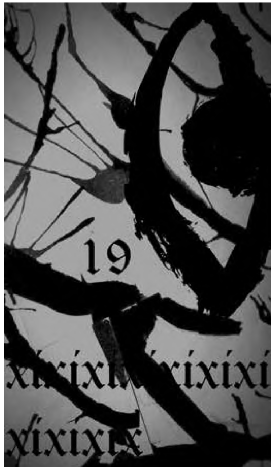
Ilustrație digitală de Mihai Dionis Barbu

în debara foșnesc ultimii caligrafi ai imperiului în hainele tale mâncate de molii delirează ultimul împărat