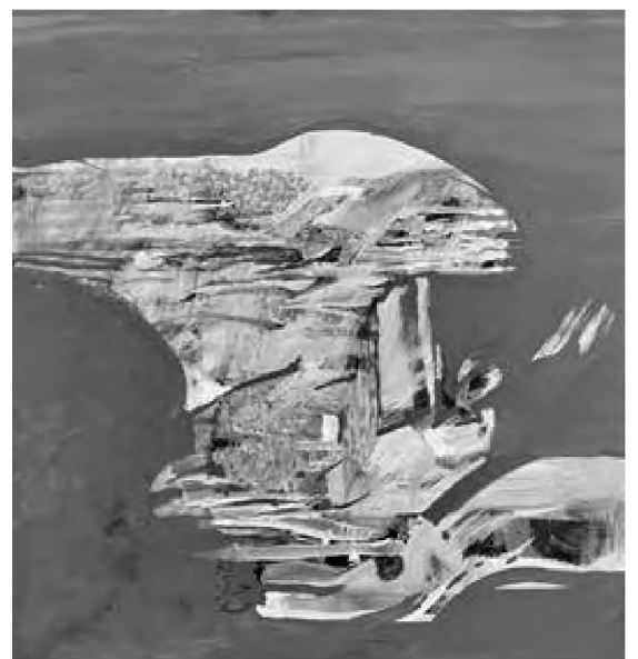
Doru Cernea tehnică mixtă, 70 x 52 cm

Toate aceste „vise de copil”, toate aceste notații fugare aparent, care însă ascund mii de sclipiri, sunt ca niște lacrimi în ploaie, ele ascund și totodată relevă trăirile celor doi autori, unite prin poezie și prin „spiritul cuvintelor”, cu o notă profund melancolică.