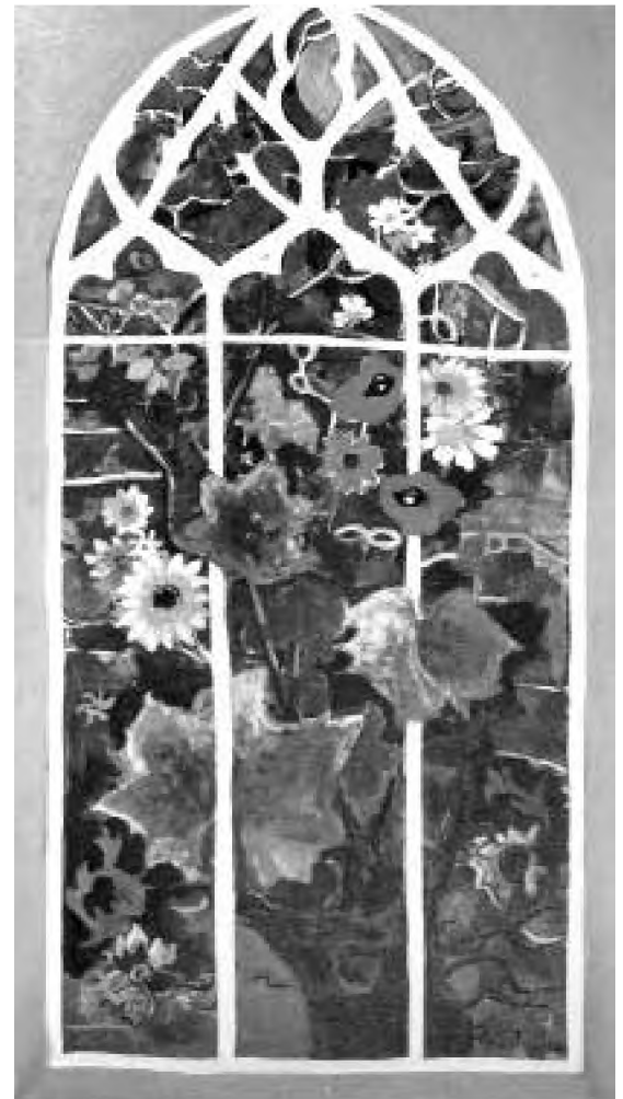
Angela Tomaselli Fereastră vara (2011) acrilic pe pânză, 140 x 70 cm

7 Oceanul contrariilor capătă o altă configurație față de cea relevată prin cunoașterea obișnuită: ... aceasta este taina: faceți din cele două, una! – spune Iisus ca un veritabil gnostic. Și când veți face din bărbat și din femeie o singură ființă, [...], și ceea ce este sus să fie și jos, [...] atunci veți intra în Împărăție. ( Evanghelia după Toma )