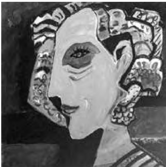
Angela Tomaselli Poetul (2010) acrilic pe pânză, 70 x 70 cm

„Inima lumii e-n viul de vânt” spune poetul clujean Ion Istrate, prietenul meu drag. Ca istoric, nu pot decât să cred și să susțin că adevăratele valori ale omenirii sunt, cu certitudine, cele care se aleg la suprafață ca untdelemnul din apă, care rămân neclintite de viulul vântului. Din punctul de vedere al naturii umane, nimic nu s-a schimbat: ne conducem de mii de ani după aceleași legi, supuși aceluiași nevoi omenești și ale firii, ce dictează ca binele, frumosul și adevărul să triumfe la capătul