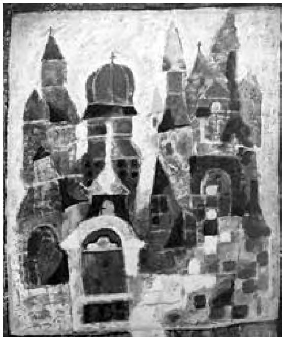
Angela Tomaselli acrilic pe pânză, 60 x 50 cm

În textul De facie , atunci când intelectul s-a separat, sufletul rămâne singur, se dizolvă, cu rezerva că el nu are în sine o amprentă mai pu-ternică decât inteligența, din cauza viciilor și pasiunilor care l-au hrănit atâta timp cât era în viață; în acest caz el a rămas într-o stare de somnolență, capabil să-și revadă viața sa pă-mântească, existând posibilitatea de a recădea din nou în corpul lipsit de intelect și pradă pa-siunilor. 9 Se găsește în mitul lui Timarh, din de De genio Socratis , o topografie mai complexă. Personajele de aici văd planetele în felul unor insule strălucitoare a căror culoare este schim-bătoare, de formă rotundă, și care se mișcă în