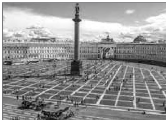
Muzeul Ermitaj, Sankt-Petersburg

În final, colecția a ajuns în Rusia, iar Denis Diderot și François Tronchin au fost răsplătiți „regește”. Cu toate acestea, Diderot a ieșit din această „afaceră” cu reputația ușor „șifonată”; după încheierea tranzacției, Diderot îi scria Ecaterinei a II-a: „Am trezit cea mai cumplită ură publică, și știți de ce? Pentru că v-am trimis picturi. Cunoșcătorii țipă, artiștii țipă, bogații țipă. Dar, în ciuda scandalului, eu rămân același.” 10 Efortul și insistența lui Denis Diderot au făcut ca, în ciuda protestelor contemporanilor săi, o mare parte din colecția Crozat să rămână în posesia aceluiași colecționar și să facă parte, în prezent, din patrimoniul Muzeului Ermitaj.