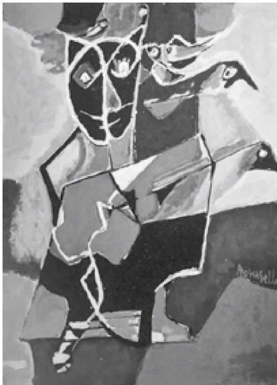
Angela Tomaselli acrilic pe pânză, 40 x 35 cm

De fapt, făcusem cândva ca rusoaica din lagăr! Mă rog, mutatis mutandis. Dacă e permis ca ceva grav, existențial, să poată fi comparat cu un act gratuit, copilăresc. Ceea ce este aidoma e acel zvâc al clipei. M-am dus la o corijență (de biologie), în locul unei colege, pe care am văzut-o devenind verde la față și alunecând moale, de-a lungul peretelui. Venisem s-o susțin, repetasem cu ea... S-a întins pe culoar, cât