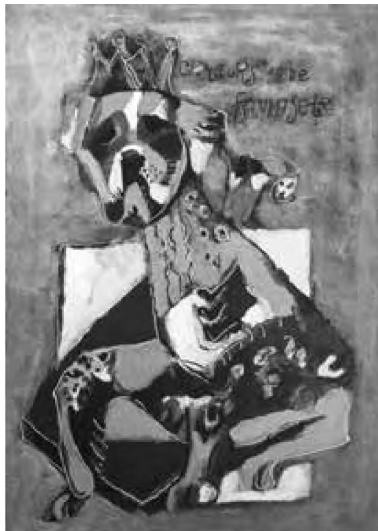
Angela Tomaselli Concurs de frumusețe (1990) acrilic pe pânză, 40 x 35 cm

Cea de-a doua apariție surprinde un personaj feminin vizibil metamorfozat, ca expresie a concesiei pe care Marga se străduiește să i-o facă lui Neculai Isac, dar nu numai lui, ci în primul rând civilizației. De data aceasta ea „s-a gătit”, s-a împodobit, mascându-și simplitatea esențială ce o definește. Naratorul constată aceasta și o mărturisește fetei („Te-ai gătit de duminică”), reținând detalii ale vestimentației care se motivează convingător din unghiul coerenței semnificațiilor textului: „era îmbrăcată cu fusta ei roșă și cu polca albastră. La cap își pusese o batistă ca sângele, gâtul îi era plin de hurmuzuri. În picioare avea încălțări nouă.”