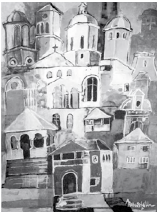
Angela Tomaselli Arhitecturi din Vâlcea (2013) acrilic pe hârtie, 40 x 30 cm

(fragment din romanul Cronovizorul în curs de apariție la editura Polirom)