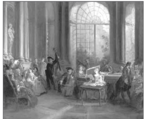
Nicolas Lancret (1690-1743) Concert în Salonul oval al lui Pierre Crozat (cca. 1720-1724) Dallas Museum of Art, USA

Relația lui Denis Diderot cu Împărăteasa Rusiei data deja din 1762, când Diderot s-a decis să-și vândă biblioteca pentru a-i lăsa o dotă considerabilă fiicei sale. Ecaterina a II-a a cumpărat biblioteca, lăsându-i lui Diderot dreptul de folosință până la moarte și desemnându-l bibliotecarul fondului de carte. Gestul Ecaterinei II i-a permis filosofului să lucreze la opera sa fără a avea griji materiale. Începând cu anul 1783, Diderot a devenit din ce în ce mai preocupat de post-eritatea scrierilor sale și a realizat trei copii ale acesteia: una pentru el, una pentru fiica sa și una pentru Ecaterina a II-a. La doi ani după moartea sa, în 1786, biblioteca și arhivele lui au fost transferate la Sankt-Petersburg. 11