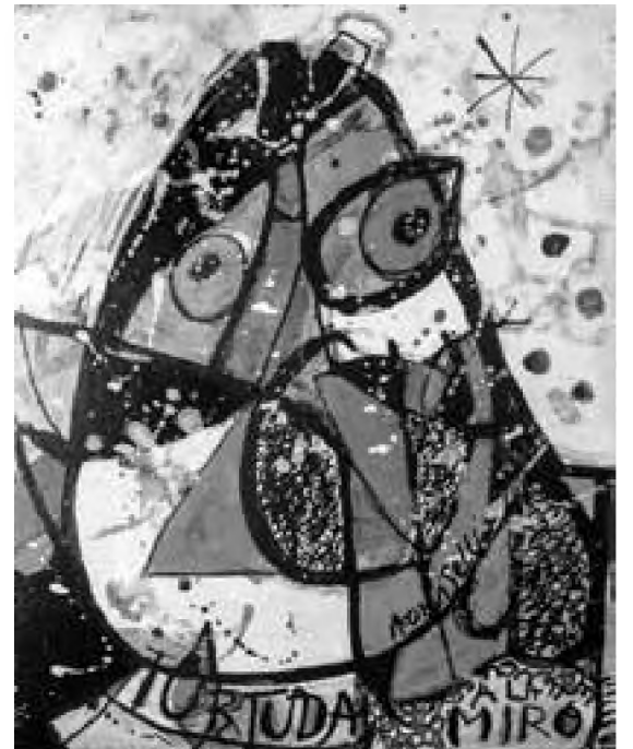
Angela Tomaselli Țurțudan „incodeiat” à la Miró (2015) acrilic pe pânză, 30 x 24 cm

Dând dovadă de un pragmatism tipic pentru un american, prozatorul ne avertizează că nu există un Depozit de Idei, o Centrală cu Povești sau o Insulă a Bestsellerurilor Îngropate. Ideile care stau la baza poveștilor bune par să apară din senin. Datoria scriitorului nu este aceea să găsească aceste idei, ci să le recunoască atunci când ele se arată. Pornind de la propria sa experiență de creație, Stephen King nu ezită să dezvăluie tot ceea ce știe despre cum să scrii o ficțiune de calitate, fiindcă este conștient de faptul că misterul esențial este munca asiduă. Încearcă să fie cât mai concis, deoarece a vorbi despre scris nu este același lucru cu a scrie. Recunoaște că își iubește foarte mult meseria, motiv pentru care se declară destul de optimist. Vrea să îi încurajeze pe tinerii creatori, dar îi previne asupra dificultăților care îi așteaptă. Autorul de succes menționează că, dacă cineva dorește să devină scriitor, trebuie să realizeze două lucruri majore: să citească mult și să scrie mult. Opinie discutabilă, deoarece nu