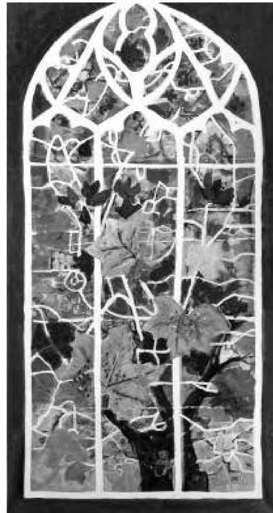
Angela Tomaselli Fereastră toamna (2011) acrilic pe pânză, 140 x 70 cm

În ce privește aspectul literar de care aminteam în titlu, acesta se reliefează printr-un studiu de caz în care, zice autorul, „am stat de vorbă cu un albanez din provincia Kosovo, pe nume Berișa Etem, fost ofițer al armatei iugoslave și care nu s-a supus ordinului de recrutare, refuzând să fie trimis pe front împotriva slovenilor, fugind în străinătate și stabilindu-se în cele din urmă în România, la Oradea”. Acesta e căsătorit cu o româncă, dar - probabil pentru că România nu recunoaște independența noului stat Kosovo, zice el - nu i s-a acordat cetățenia română, deși a încercat de trei ori până acum. Pe bulevardul Decebal din Oradea, la sediul firmei „S.C. Kosova S.R.L.”, Pașcu Balaci îi ia un interviu lui Berișa Etem, în care acesta, între altele, povestește despre demonstrațiile pentru independența Kosovo, din anii 80 „când președintele Iosip Broz Tito a venit la Priștina și Prizren să domolească spiritele. Croatul Tito, zice Etem, a încercat mereu să dea albanezilor kosovari aproape toate drepturile pretinse; dar apoi,