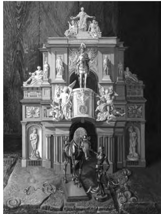
Michael Lassell Triumph , ulei pe pânză, 100x80 cm, 2010

Școala românească a avut mereu un bun renume, așa cum spuneți, sunt destule exemple de români care au reușit în profesiile lor, în străinătate, datorită studiilor absolvite în România. Dar, în momentul de față, se cam vorbește la trecut despre