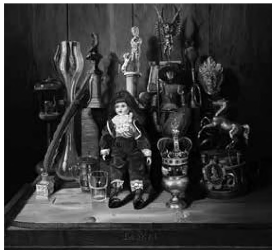
Michael Lassel Lexiconul de vise al unei păpuși , ulei pe pânză, 80x90 cm, 2010

Prima dintre trăsături este perceperea specială a timpului, adică a viitorului și conștiința morții. Pentru că omul „percepe moartea în acest fel particular, adică nelegată de timpul prezent, ci făcând trimitere la altceva (la o formă de supraviețuire) putem distinge prezența timpului în conștiință.” Acest fel special de percepție, aduce cu sine „irumperea