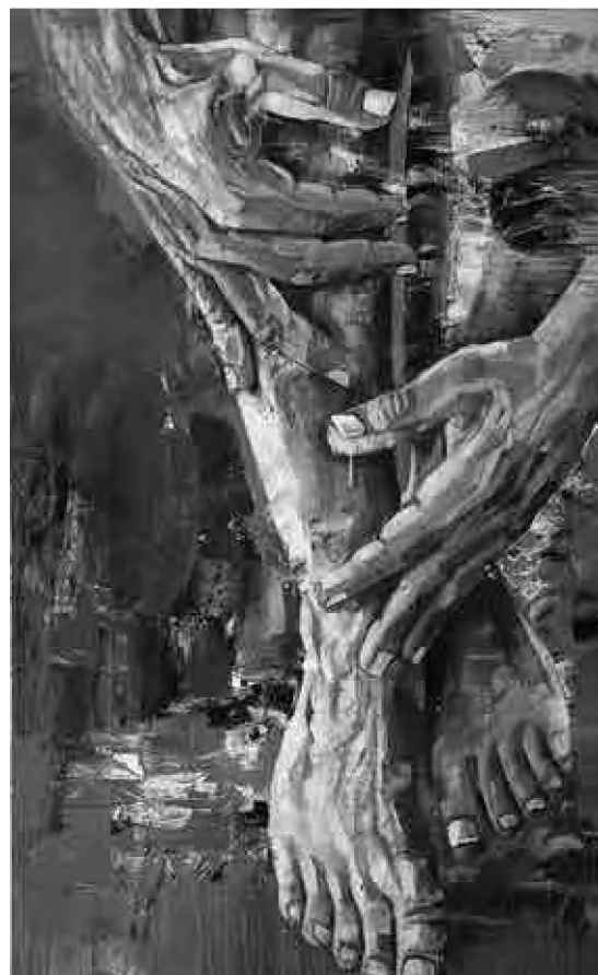
Sorin Dumitrescu Mihăești Studiu anatomic (2014), culori acrilice, 100 x 60 cm

Pasul următor necesită lămurirea unui alt termen, și anume cel de contemplan. În limba latină vocabula theoreîn a fost tradusă prin contemplatio , a contempan, a fi absorbit în privirea a ceva. Latinii au observat că verbul contemplatio este format din prepoziția cum și templum , și ar avea sensul de a fi în templu. În Somnium Scipionis , Cicero ne spune că Scipio Emilianus, aflat în vizită la regele Massinissa, are un vis în care îi apar bunicul său Scipio Africanul și tatăl său Paulus Aemilius.