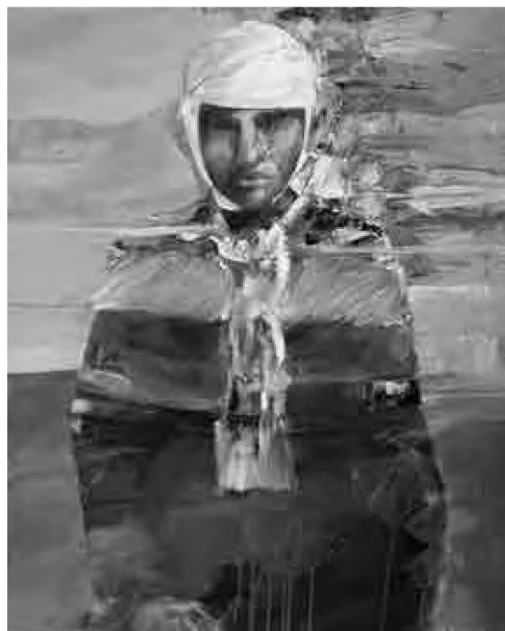
Sorin Dumitrescu Mihăești Celălalt (2016), culori acrilice, 90 x 70 cm

Tentative, se știe, au fost, de-ar fi să pomenim, de pildă, eșecul realismului socialist, ca primă revoluție canonică, încercând a impune o literatură nouă (ca moment zero). Și după decembrie '89 s-a propus, de pe poziții maniheice, cu vehemențe justițiare, o reconfigurare a canonului printr-o grilă „sever controlată politic”