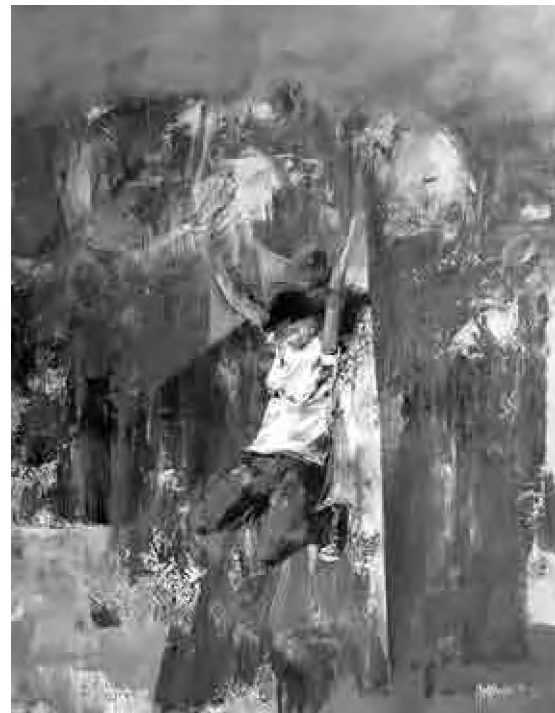
Sorin Dumitrescu Mihăești Înrădăcinări , culori acrilice, 90 x 70cm

Am scris mai sus despre „lumile” din cartea/ cărțile lui Victor Tecar: a realului, a visului, a