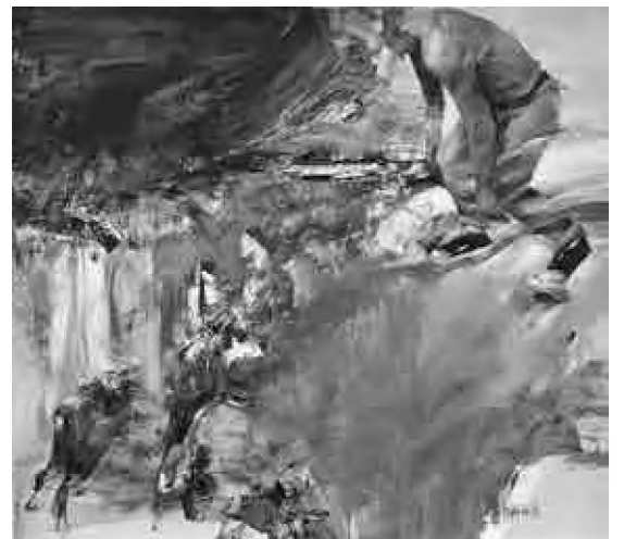
Sorin Dumitrescu Mihăești