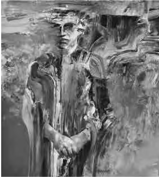
Sorin Dumitrescu Mihăești Apostol (2018), culori acrilice, 100 x 90 cm

Militanța intransigentă de la microfonul Europei libere blama obediența „propagandabililor”, duplicitatea, în contextul constrângerilor regimului. Ea satisfăcea „datoria țipătului”, mărturisirea V. Ierunca, venind în întâmpinarea celor cărora „soarta le-a legat limbile”. Dar această receptivitate trează, după criteriile polițienești, vânând carențele morale în speranța salubrității mediului literar, întocmind liste etc. s-a prelungit și în postcomunism. Evident, tradiția succesivelor epurări e veche și ea nu ține doar de experiența comunistă. Un șir de excomunicări, denunțuri, ocultări sau demascări etc., încercând, cu zel bolșevic, a alunga „colaboraționismul” a transformat un „litigiu patrimonial” într-o înfloritoare dosariadă și în postcomunism, propunând, fără succes, o literatură „lustrată”. Încât, vocal, ascultat și căutat, un V. Ierunca se dovedește, nota caustic Nicoleta Sălcudeanu,