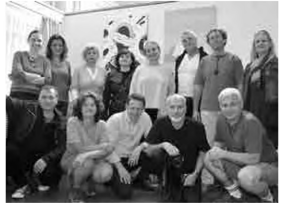
Participanții Taberei „Mallnitz Travelling Art II” 2019