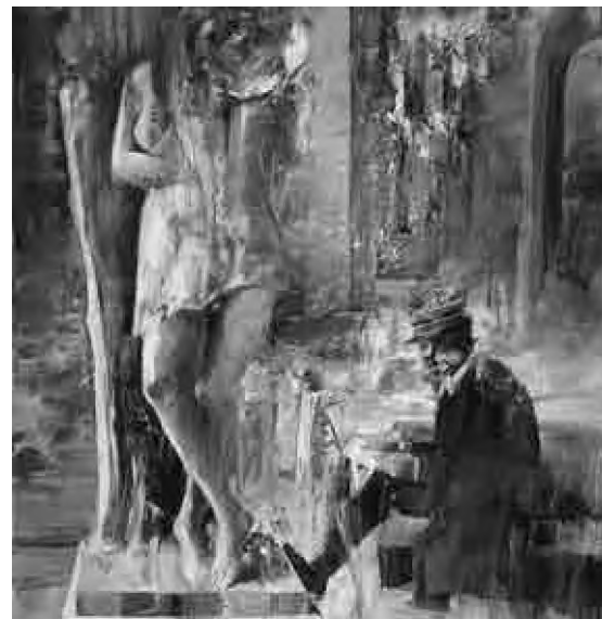
Sorin Dumitrescu Mihăești Liniste (2018), culori acrilice, 100 x 80 cm

Nu vă așteptați la o încheiere cu soluții. Nu există. (Îmi pun și eu o întrebare retorică, exact în spiritul acestor nietzscheeni de rit nou: și dacă Antropocenul este ultima epocă din istoria planetei Terra? (nu spun a omenirii). Cu alte cuvinte, dacă Antropocen nu e, nimic nu e!