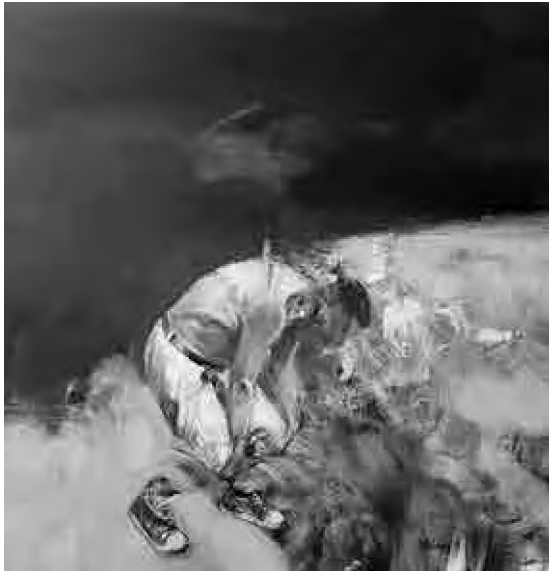
Sorin Dumitrescu Mihăești Frângere (2018), culori acrilice, 80 x 80 cm.tif

Tocmai am parcurs o culegere de texte ale unor tineri intelectuali români (peste 30 de autori) Postumanismul , apărută la Tracus Arte. Lectura ei m-a făcut să schimb planul inițial al acestor note, pentru că intră în dialog cu tema mea. Mi-am dat seama că termenul creat în joacă mai sus, inumanism , strânge perfect toate cele trei concepte pe care filosofii de azi le-au inventat și le tot despică: postumanism , transumanism , antiumanism . Pentru că toate sunt, dincolo de sofisticarea analizelor, inumane . Câteva citate doar: „Iluzia că omul a construit singur lumea – fără nicio contribuție a celorlalte specii – nu diferă