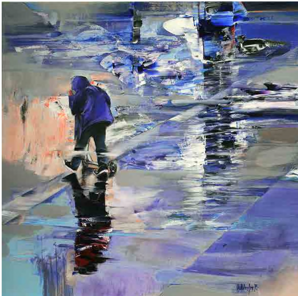
Sorin Dumitrescu Mihăești

Oglindiri (2015), culori acrilice, 80 x 80 cm