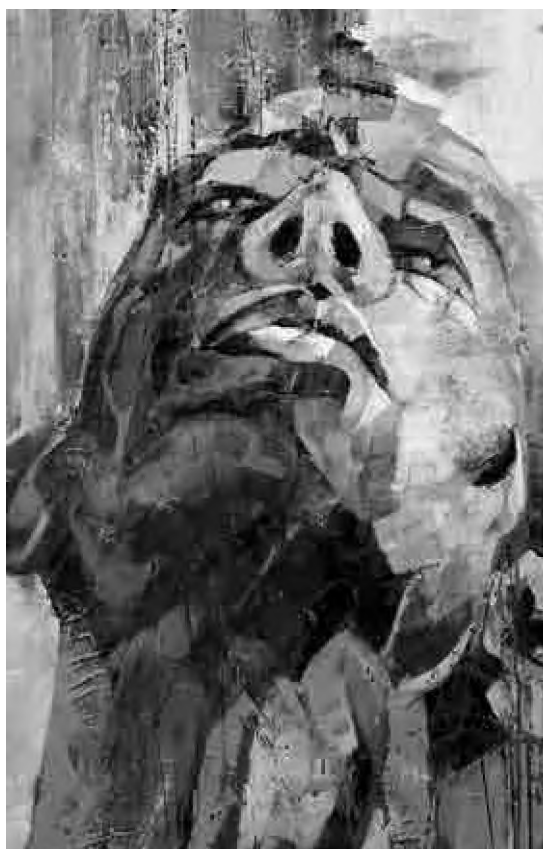
Sorin Dumitrescu Mihăești culori acrilice, 100 x 60 cm