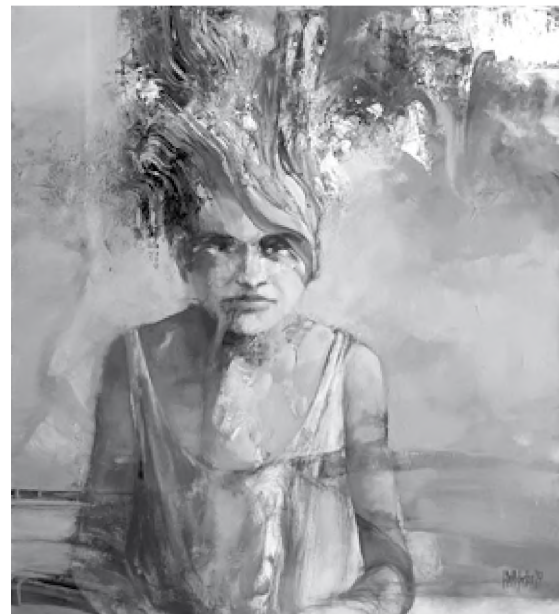
Sorin Dumitrescu Mihăești Sub gânduri (2019), culori acrilice, 90 x 80 cm

..... Totul a pornit într-o noapte cețoasă de toamnă. Totul putea la fel de bine să nu se întâmple. Din nou se dovedea că nimic nu este întâmplător. După episodul cu eliberarea, toate procesele sindicatului mi-au trecut prin mână. Și a fost bine