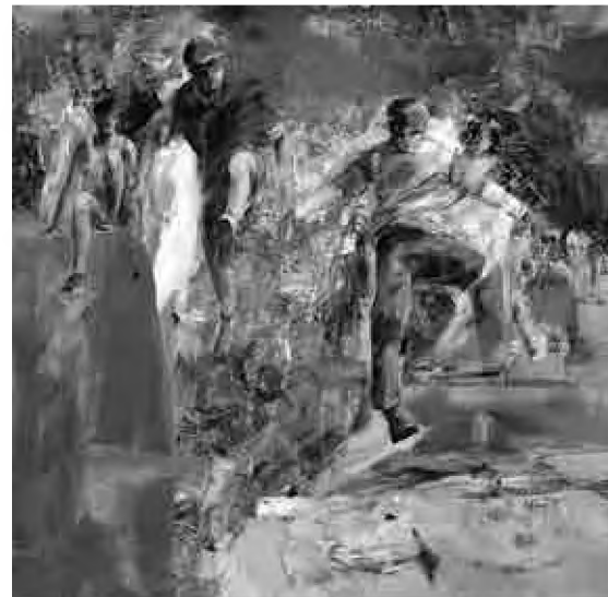
Sorin Dumitrescu Mihăești Viața la linia de start (2018), culori acrilice, 100 x 100 cm

(Sălcudeanu 2013 : 64). Și cum volumul Nicoletei Sălcudeanu discuta, cu onestitate și minuție interpretativă, chestiunea revizuirilor și a revizionismului în literatura postcomunistă, cercetarea peisajului literar, identificând fie spaima de revizuire (blocând procesul), fie, dimpotrivă, canibalismul axiologic, demolator, devine obligatorie. Pornind, firește, de la preceptul lovinescian, criticul de la Sburătorul vorbind de teoria mutației valorilor estetice și a autonomiei artei. Și înțelegând procesul, în primul rând, ca autorevizuire.