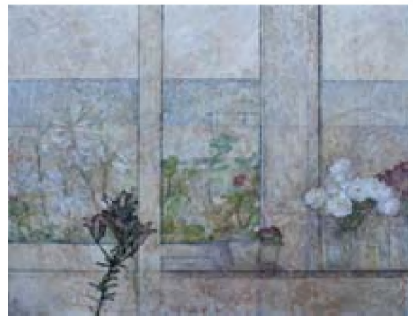
Horea Pațina Fereastra (2011)

„cu lama de ras să șteargem bronzul duminicilor/ care stă ca o cămașă de forță peste bucuriile simple/ ca un strat de ciment peste fericirea așază mică cum e/ și strînsă în clopotul cu care sunăm dimineața” ( Cu lama de ras ștergem bronzul duminicilor ).