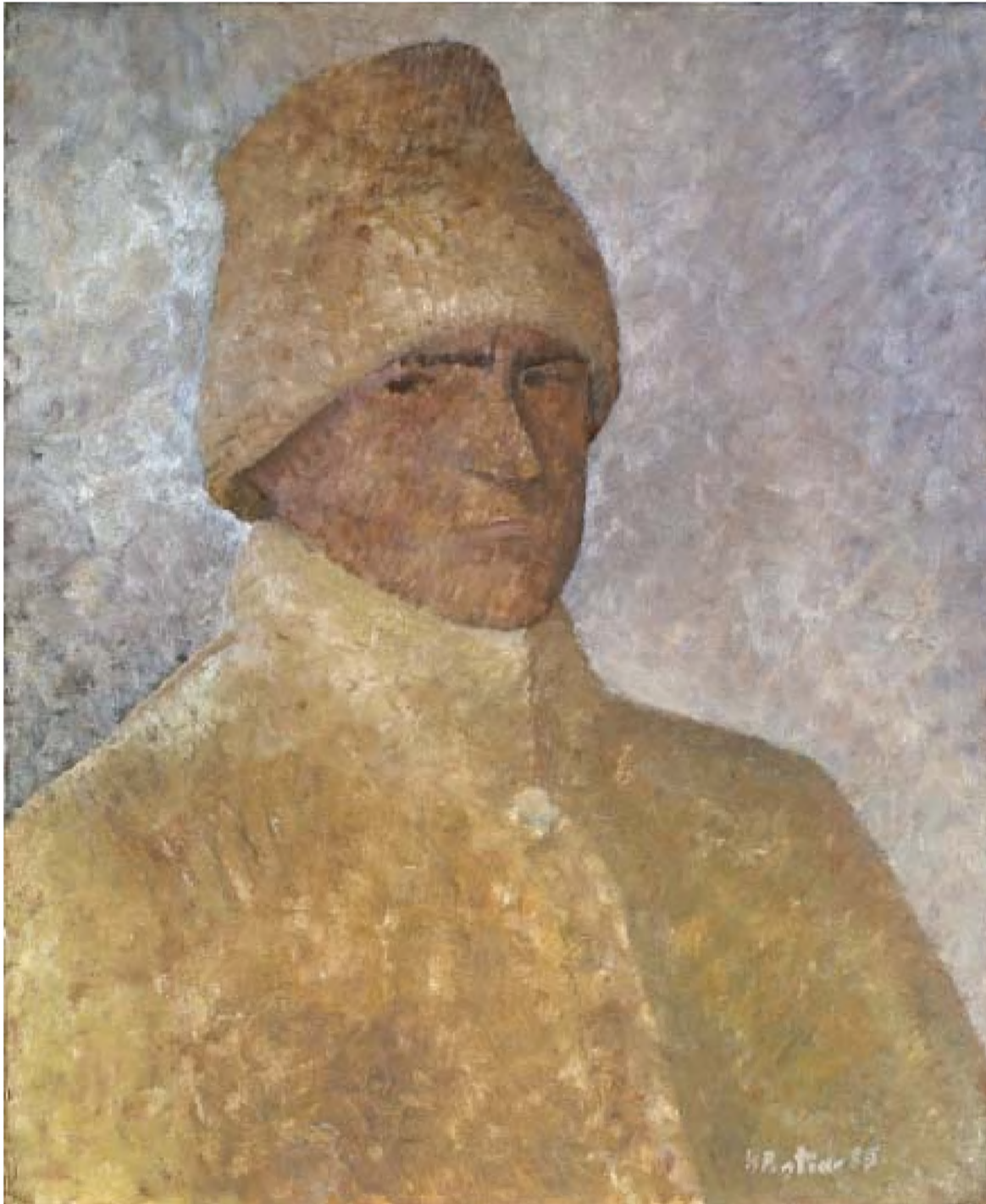
Horea Pa o tina