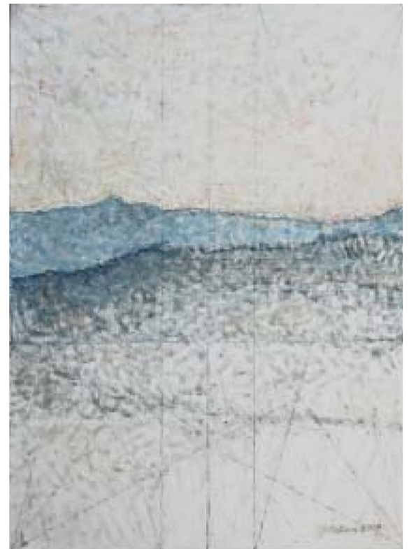
Horea Paștina Peisaj la Panaci (2009), ulei pe pânză

Cetatea Gherlei ascunde și azi multe mistere. Aici, după ce cetatea a devenit închisoare (1785) și până azi, nu s-au putut face cercetări