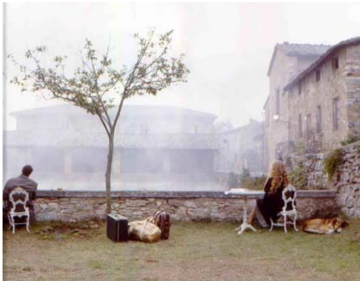
Cadru din Nostalgia (1983)

5 „Din păcate, nu mă pot ruga într-o biserică catolică. Nu că nu pot, nu doresc. Este un loc care mi-e străin.” (Andrei Tarkovski)