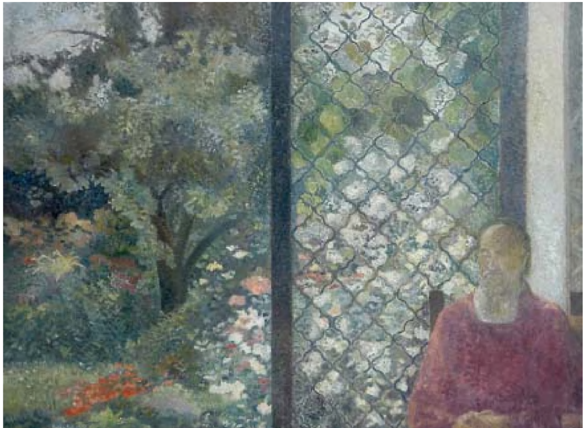
Horea Pățina Grădina din strada Rozmarin. Domnul Nasta (1987) , ulei pe pânză, 146x195 cm

3. După Cristina Cioabă, cetatea Trapezunt ar simboliza lumea întreagă. Poemul ar fi despre „suferința părăsirii de sine, care promite eliberarea din capcana timpului” (p. 293). Sub cetate s-ar