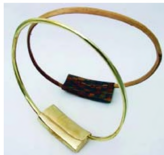
Maxim Dumitra Absența încercuită (2008)

Ce expune Maxim Dumitra? Structuri circulare suspendate la înălțime, „absențe” încercuite, „goluri” circumscrie prin contur desenat. Intenția artistului este aceea de a capta spațiul în orizon-