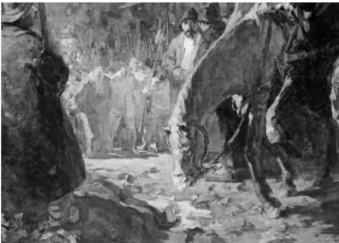
Doja la Arad