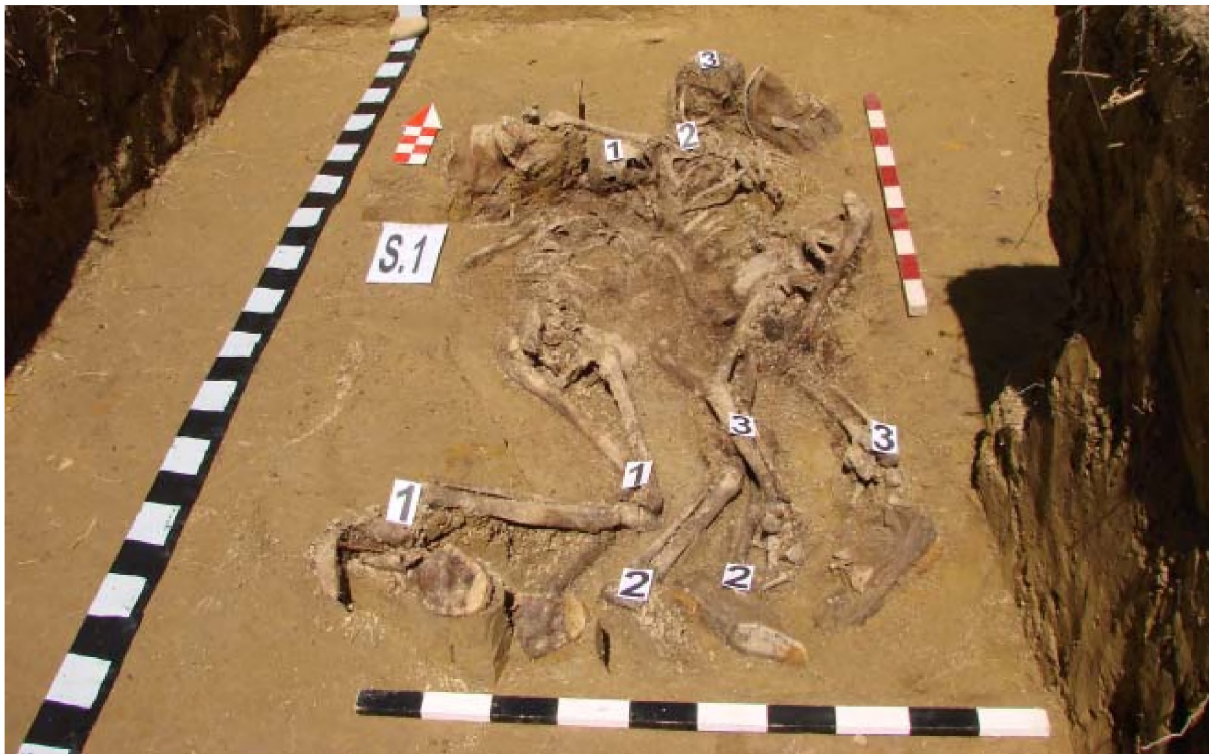
Rămășițele pământești ale celor trei victime după deshumare