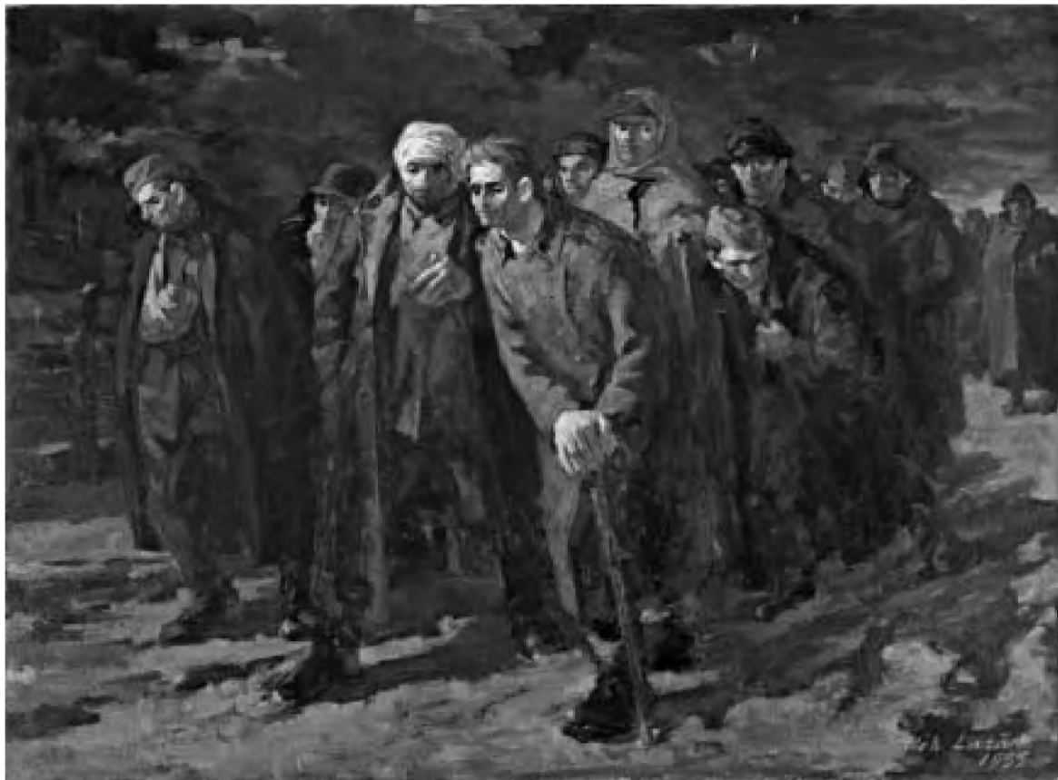
Coloana de prizonieri