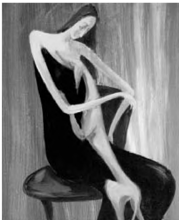
Femeie cu câine

- La ce bun să-mi anunț proiectele, câte or fi, aidoma unei reclame la un produs ce "urmează să apară în curînd pe piață"? Mă aflu angajat cu colaborări permanente la o seamă de reviste (vai, vreo zece), câteva din ele găzduindu-mi "cronica literară". E, după cum știți, o rubrică băgată-n corzi, reabilitată, iarăși obiect al disprețului, dar care supraviețuiește vicisitudinilor, se vede ca o necesitate a contactului prim cu creațiile literare. După ce am slujit-o aproape cinci decenii, mă învrednicesc a supune în continuare comentariului meu între 40 și 50 de cărți pe an, dar... am obosit. Ce să fac mai întâi? La ce să renunț, cum să-mi reechilibrez munca? Mă simt atras progresiv, pe lângă poezia ce rămîne noua-vechea mea practică de căpetenie, de o formulă,