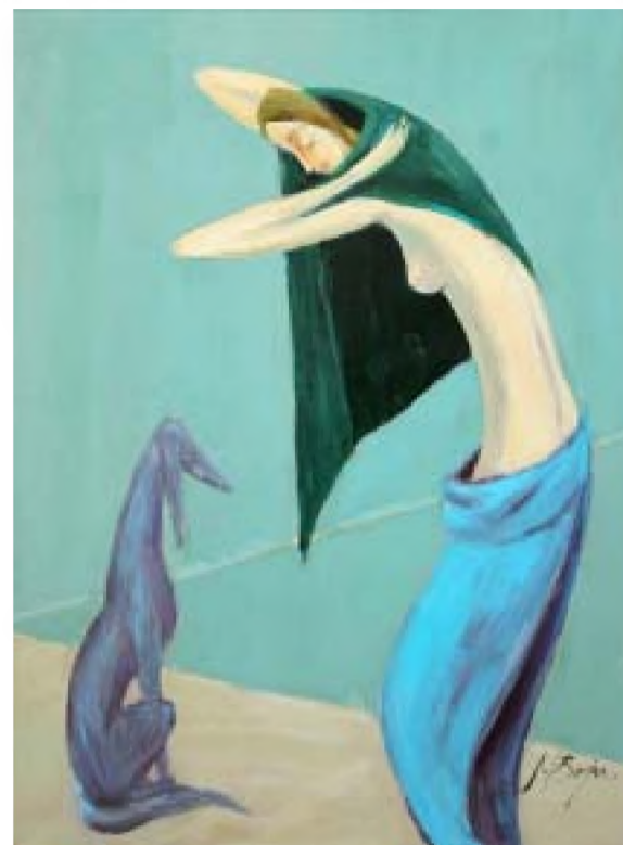
Femeia și câinele

Vor fi cu noi întotdeauna; altminteri suntem goi și morți.