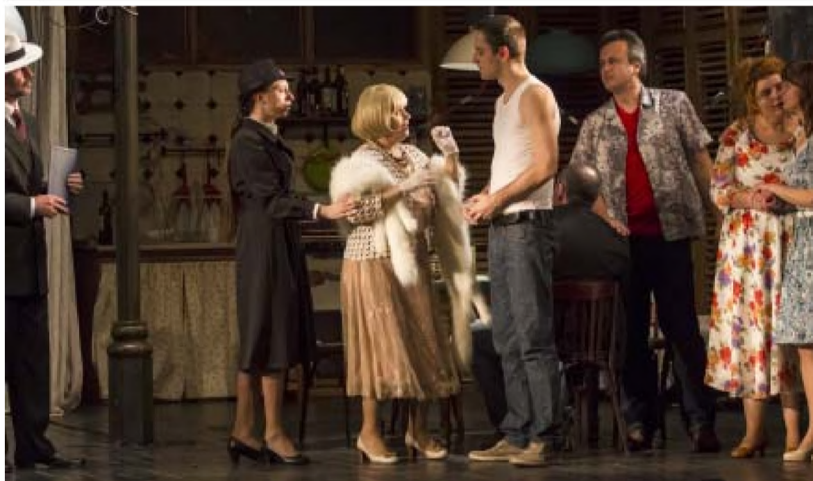
Un tramvai numit dorință