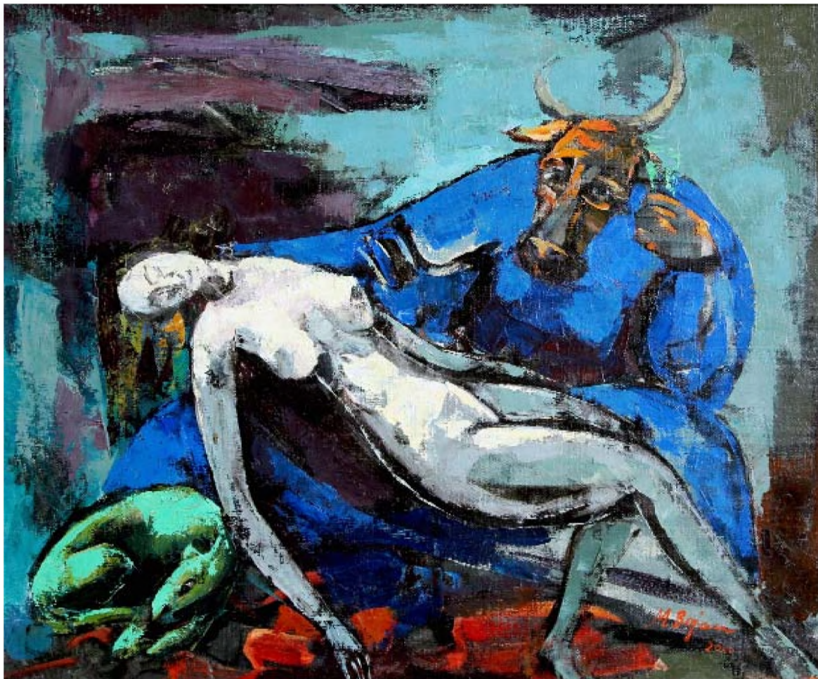
Fecioara cu minotaur II

Motto: „Manipularea prin uniformizarea gândirii și tendința de reprimare a libertății de expresie au rămas sechele greu de înlăturat după abolirea comunismului” (Filozofi români, SUA, 2011, p. 60)*