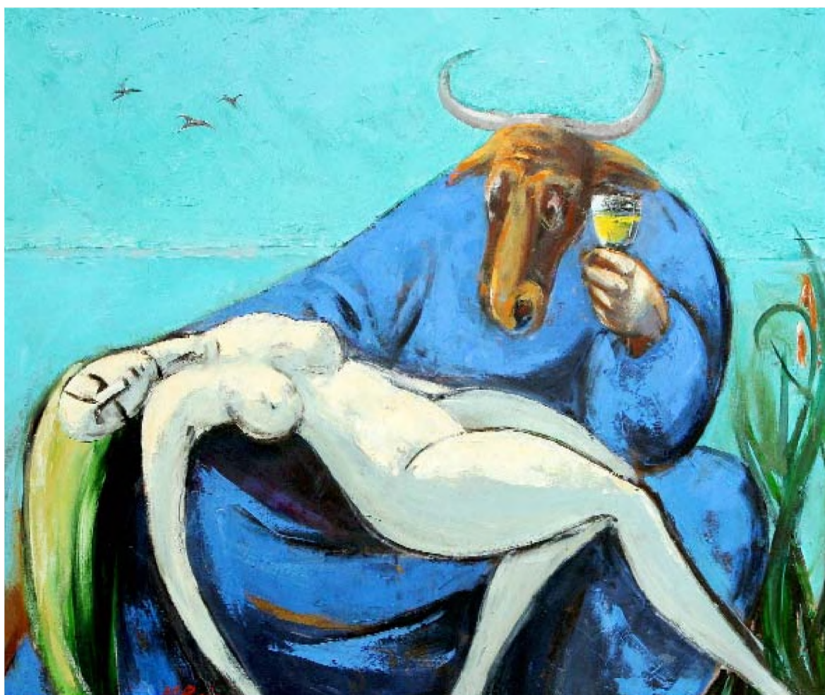
Fecioara cu minotaur

(fragment din vol. Aventurierii politicii românești. O istorie dramatică a prezentului , în curs de apariție la Editura Muzeului Literaturii Române)