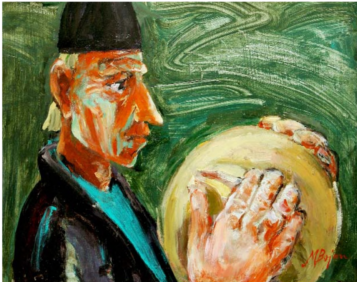
Omul cu pâinea