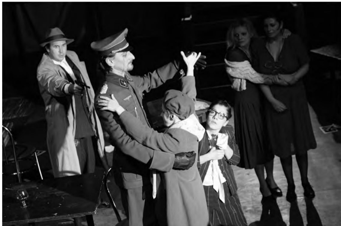
Scenă din Balul