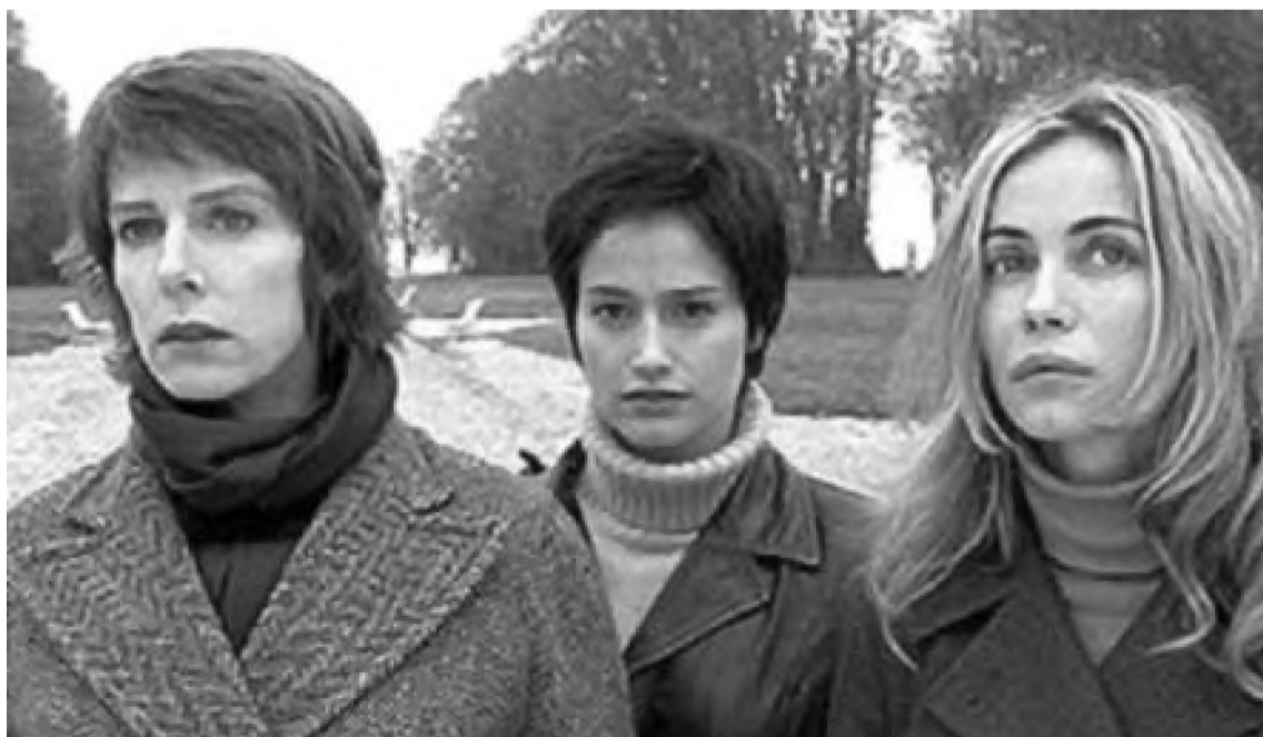
Karin Viard, Marie Gillain și Emanuel Beart