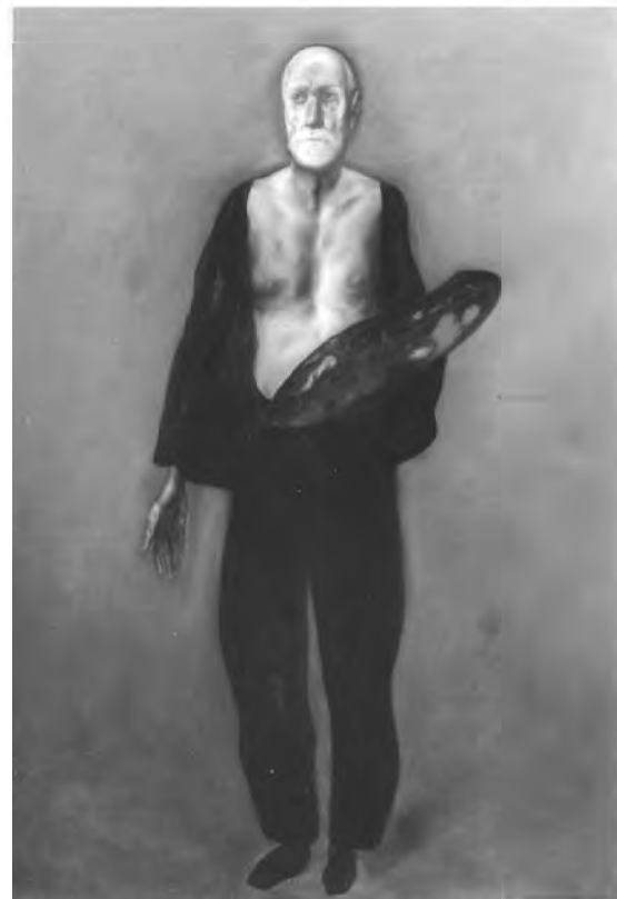
Vladimir Zamfirescu, Autoportret

ciudată frumusețe a picturii lui Vladimir Zamfirescu. Întâlnire și ea privilegiată, vernisajul expoziției, în Sălile Festive ale Muzeului de Artă Cluj-Napoca, programat pentru ziua de 1 iunie 2006 (orele 18.00), va reprezenta pentru publicul clujean și privilegiul de a se implica într-o mare sărbătoare: aniversarea a 70 de ani de la nașterea marelui artist.