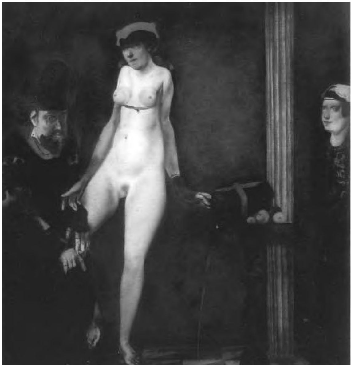
Vladimir Zamfirescu, Dansul Salomeei

Concluzia care se impune de aici nu e una pur și simplu conservatoare, ci mai degrabă ... una de „bun-simț”: literatura nu poate renunța la un anumit tip de convenție , care să o certifice în cadrul celorlalte practici discursive, un soi de fundamentalism estetic opus fundamentalismelor socio-politice și religioase. ■