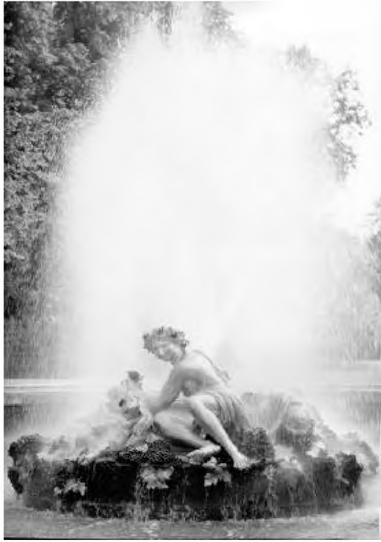
Fântîna lui Bachus. Zeul este înconjurat de satiri culcați pe o somptuasă recoltă de struguri

Revoluționarii din 1789 au împrăștiat colecțiile