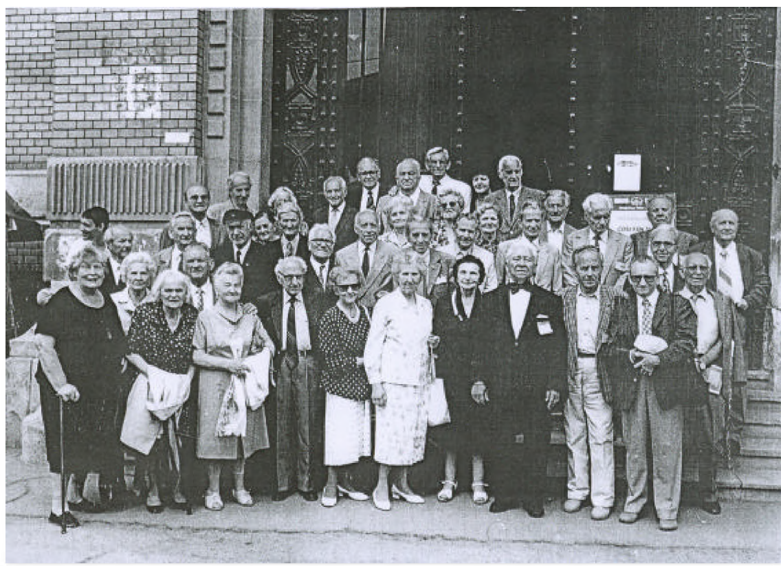
Absolvenții Facultății de Medicină, promoția 1946, la 50 de ani de la absolvire (1996)

Onorați participanți la această adunare asistați la o zi istorică în care absolvenții Facultății de Medicină promoția 1946 Regele Mihai, din cadrul Universității "Regele Ferdinand I" Cluj, în numele lor și al aceluia din țară și de peste hotar care ne-au sprijinit moral și material, predăm busturile Regelui Ferdinand I și al Reginei Maria Consiliului Academic și Rectoratului Universității "Babeș-Bolyai" Cluj-Napoca, chează a continuității spiritului de toleranță și înțelegere în activitatea prin care profesorii acestui lăcaș de cultură să transmită știința și experiența noilor generații, cu mesaj către popoarele creștine ale Europei: NIHIL SINE DEO.