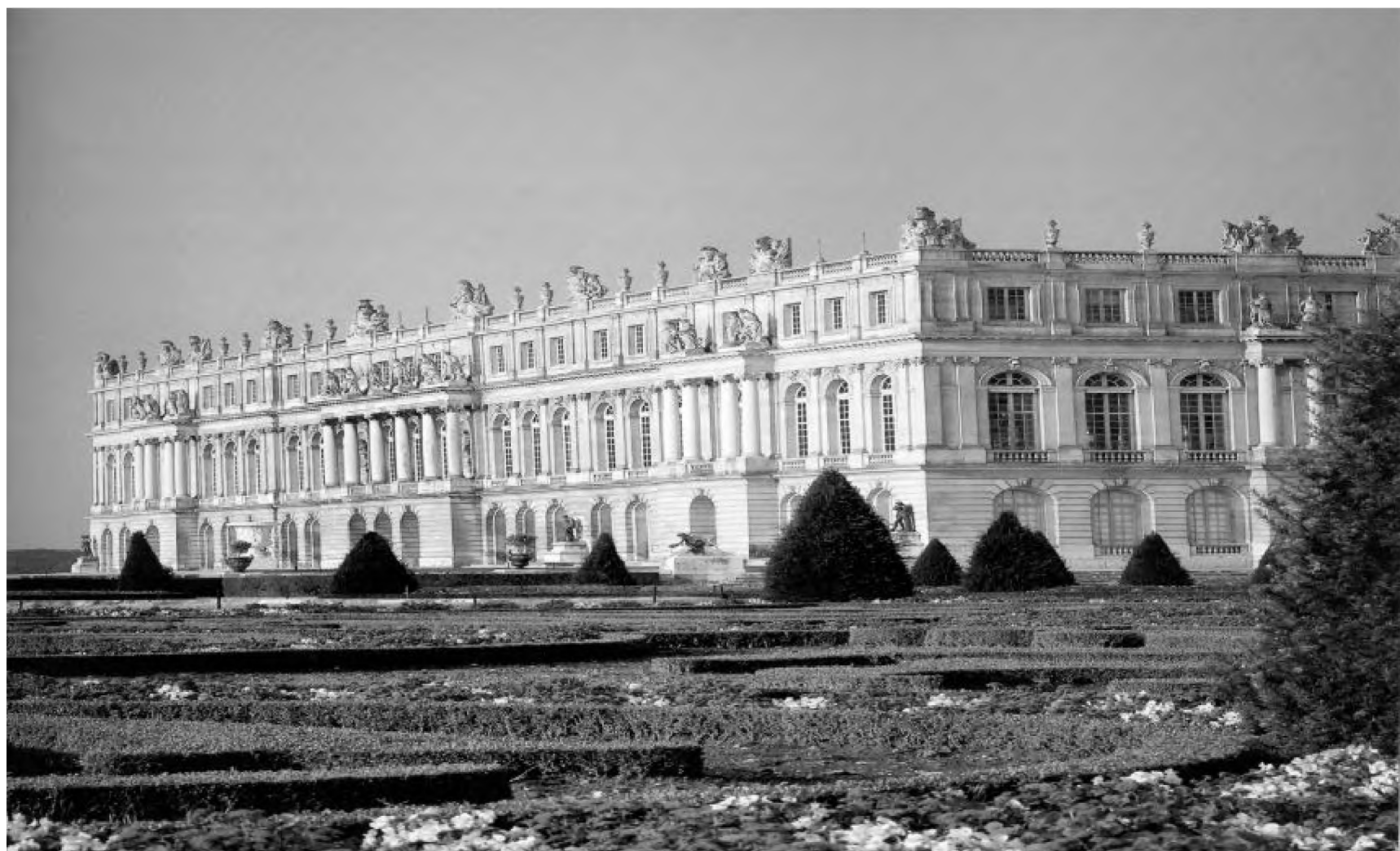
Apartamentele reginei, la primul etaj al castelului, dau spre grădina de flori de la sud, numită și "Grădina dragostei"

În ciuda exasperării încercate de unii membri ai familiei regale în anii de maximă intensitate a lucrărilor (1682-1684 cînd, arată cumnata regelui, "toate erau făcute și desfăcute, și nici un loc nu a fost modificat de mai puțin de zece ori") și a unor greve sporadice ale lucrătorilor ("răzmerițe", spun textele), castelul e inaugurat oficial în 1684. Monarhul itinerant e de acum instalat într-o reședință stabilă, din care va coordona eficient burocrăția regatului. Pe lîngă familia regală, Versailles găzduiește majoritatea miniștrilor și un număr în creștere de curteni (după unii cercetători aproximativ 3000 de persoane, după alții pînă