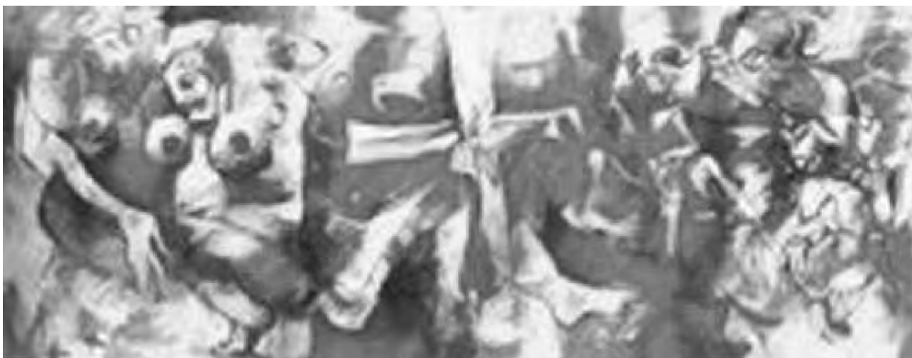
L'fe and Death's Fire in the Ash Desert

Drumuri, umbre, mituri... Dictatorul sau dumnezeul trucat depășește sfera descrierii chipului celui ce deține puterea și o folosește în mod abuziv. Ea se transformă într-un studiu despre mistica puterii zugrăvită și comentată în mulțimea de romane citate, ale căror titluri formează o bibliografie foarte consistentă dintr-o literatură „adesea disprețuită și ignorată” (p. 12). Astfel, studiul lucrează pe un teren mult mai alunecos decât ar părea și reușește să colecționeze, să clasifice și să demonteze mecanismul acestor avataruri din paia ale Dictatorului, a căruui putere e anihilată în găoacea ficțiunii. ■