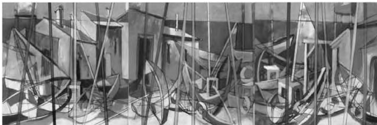
Ada-Kalech in Sunlight