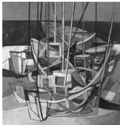
Somewhere in Pacific

– Ideea de proză s-a născut de fapt din truda la textele de exegeză biblică și filologie semitică comparată pe care le-am publicat anterior. Volumul apărut la „Cartea Românească” e o versiune literară, aș spune eu, la lucrările cu caracter pur disciplinar. E o cale de a ieși, cel puțin pentru câțiva timp, din monotonia rădăcinilor verbale sau îndărătnicia guturalilor, din puzderia interpretărilor biblice, și de a te arunca nebunește în visarea dulce a clipei de ieri și de mâine, dar nu a celei de azi. Când s-a născut ideea acestei cărți? Cam o dată cu sosirea mea în această țară și ruperea de trecut. Am publicat prima născută „Pelerin în lumea copilăriei” în 1991 în almanahul „The Faith” („Credința”) din Detroit,