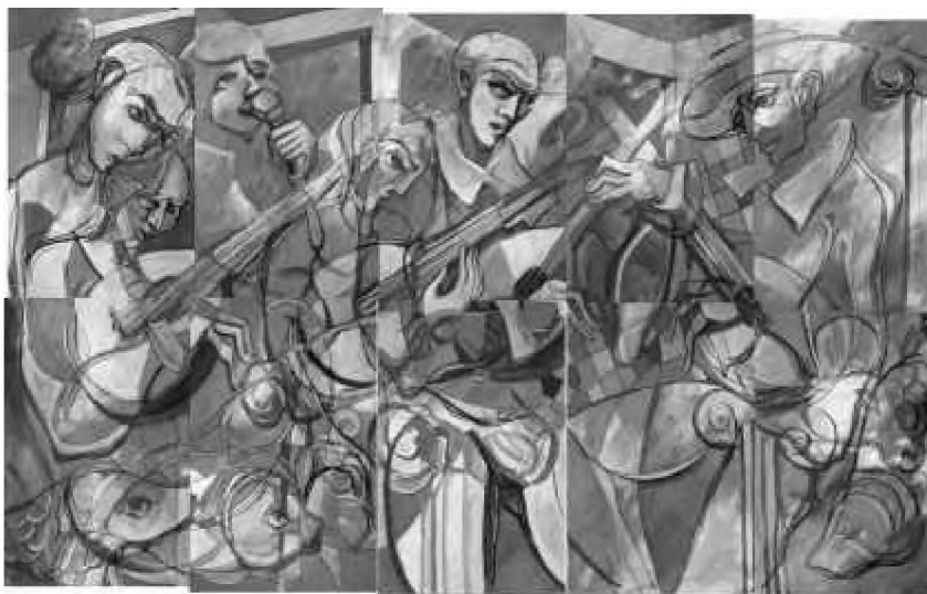
Fado's melody for eternity