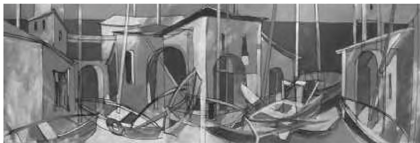
Old Townhall From Ada-Kalech

Rămâne să urmărim evoluția viitoare a acestor imprevizibile și capricioase "imagini în mers" prefigurate tainic în fărâme rare ale trudei cotidiene de atelier.