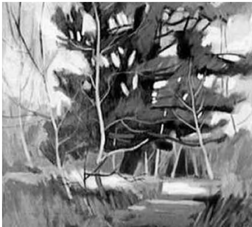
The Lonely Pine

Din grupul celor care au primit de curând botezul noii Europe, scriitorul maghiar Esterházy Péter privește într-un fel foarte „est-european” argumentele habermasiene ale „renașterii europene” 3 . El mărturisește că fiind, pe vremuri, un est-european, apoi un central-european, invitat la „masa rotundă” a proiectiilor despre