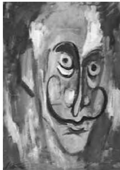
Salvador, the poet

Introducerea de la 1 ianuarie 2004 a TVA-ului pentru carte (probabil prin intermediul Codului