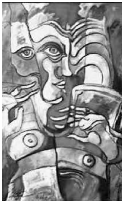
The Queen from Saba