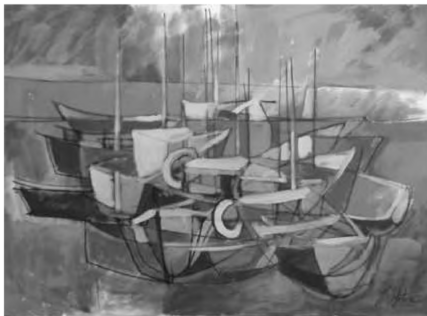
Boats in the port

Sub îndrumarea lui Slavici, Tribuna devine nu numai un recunoscut centru de lucrare literară, așa cum își propusese, dar și unul de lucrare politică, militantă, fixând un tipar și un cadru organizatoric ce va fi urmat cu strictețe de toate celelalte ziare și reviste ce-i vor revendica numele, între care se așează la loc de cinste Tribuna de la Arad (1897-1912), cea de la București din 1915, Tribuna lui Ion Agârbiceanu de la Cluj, din anii 1938-1940 sau actuala Tribună clujeană. Exemplul strălucit al Tribunei sibiene constituie o zestre de preț pe care ea o continuă și o îmbogățește, raportul dintre tradiție și actualitate fiind și aici coordonata majoră a succesului ei.