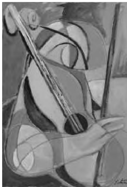
The La Fontaine's cricket

modern-otomană a destinului valah, ci, poate, mai ales în descrierea, plină de pitoresc, culoare și sa- voare, a mediului mic-burghez din Bucureștiul de altădată, încă marcat de ruralitatea sa fundamentală. Evocarea este a unui erudit și totodată a unui senti- mental, degustător de rarități, inclusiv filologice, și care pune în pagină informația înconjurată de un halou nostalgic impresionant. Dar, mai presus de toate, sarcina lui Radulian e una profund politică: