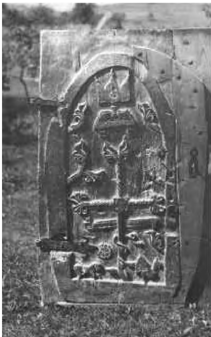
Ușa bisericii din Brădet