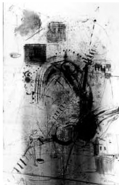
Marius Ghenescu Trepte spre albastru

Butada lui Goethe – culoarea este chimul luminii – ar putea să fie motto-ul poezicii picturale a lui Emil Dobriban; bunăoară modul în care culorile de pe paleta lui subjugă lumina transformând-o în emanație dinamică a motivelor plasticizante prezintă în adevăr devenirile întru pictură a ideilor și emoțiilor sale. Creația lui se bazează pe transfigurarea expresivă a lumii evocând-o, dramatizând-o și cântând-o aidoma mesajului baladelor