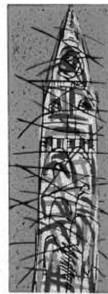
Toate drumurile duc la Roma (2002)

Noua lucrare a lui Ștefan J. Fay are meritul de a aduce în actualitate figura unei personalități remarcabile a Transilvaniei din secolul al XVII-lea, ale cărei fapte și acțiuni sunt prea puțin cunoscute, mai ales de către noile generații de cititori. Mai mult decât atât, citind cartea de față, putem constata cât de puțin se schimbă unele lucruri în istorie, în ciuda trecerii secolelor: asistăm astfel la eternele lupte pentru putere, la manevrele politice și trădările care se fac în acest sens, la dorișta unor state de a intra în tot felul de alianțe, în funcție de