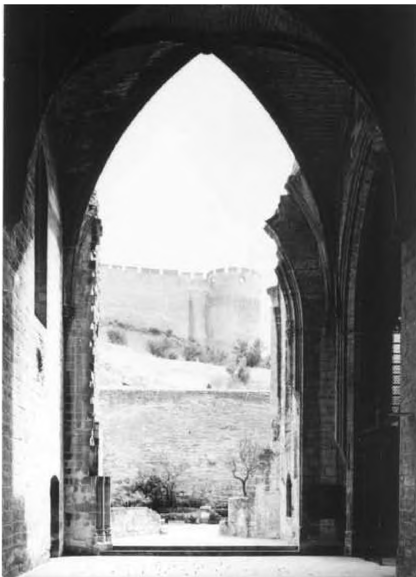
Villeneuve-lez-Avignon, Chartreuse du Val de Bénédiction

ministru adevărat al culturii” franceze. Din păcate, această onoare i-a fost acordată doar de posteritate. Mondenul personaj nu era altul decât Prosper Mérimée. Prozatorul, devenit inspector, descinde în 1834 la Villeneuve-lez-Avignon, constatând că „magnificul monument” al mormântului papei Inocențiu al VI-lea servea de dulap unui biet țăran ce folosește mausoleul pentru a depozita butoaie și trunchiuri de măslin. Strigătul de alarmă al scriitorului avea să aibă efectul scontat, dar cu oarecare întârziere. Notele de călătorie ale lui Mérimée în sudul Franței, din 11 septembrie 1843, nu vor rămâne literă moartă. În 1906 statul francez va decide restaurarea celebrei mănăstiri de altădată. Această repunere în valoare se va desfășura în mai multe etape. Iar restaurarea nu s-a încheiat nici astăzi. Altfel spus, La Chartreuse se află an de an în atenția factorilor responsabili, ca un tezaur cultural ce nu mai lasă pe nimeni indiferent, de la cei doi grădinari ai așezământului până la ministrul culturii.