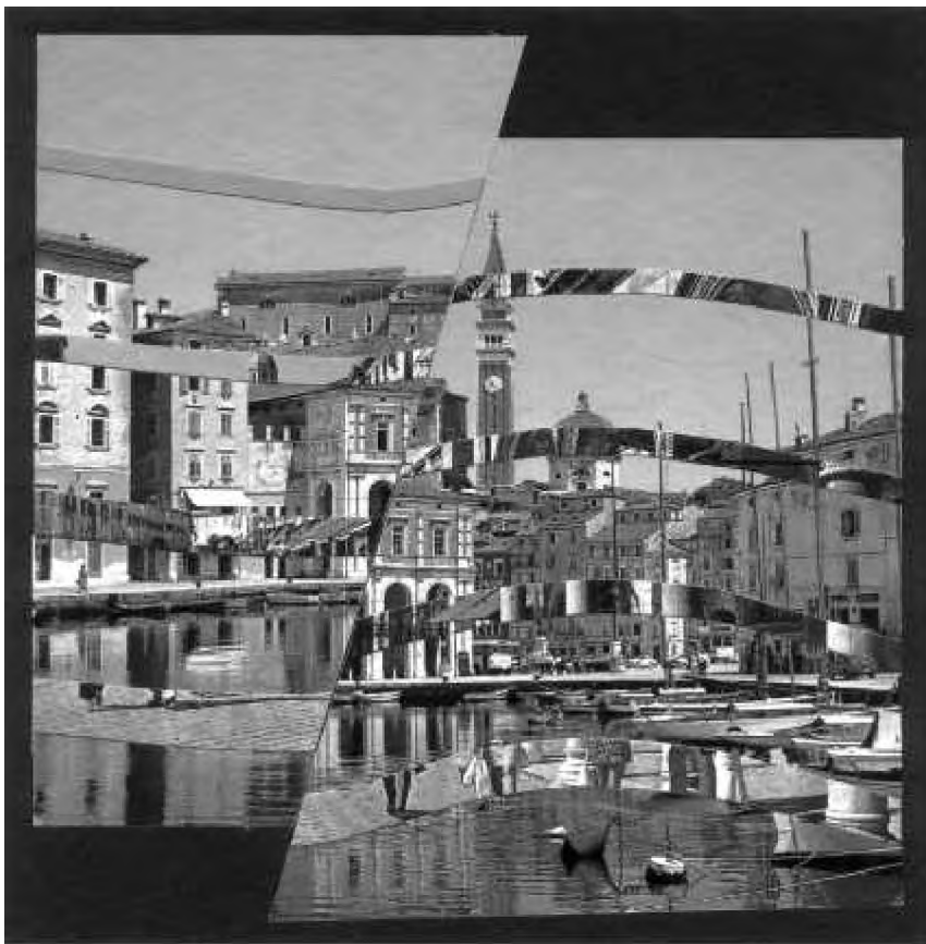
Mauro Mat fredri (Italia)