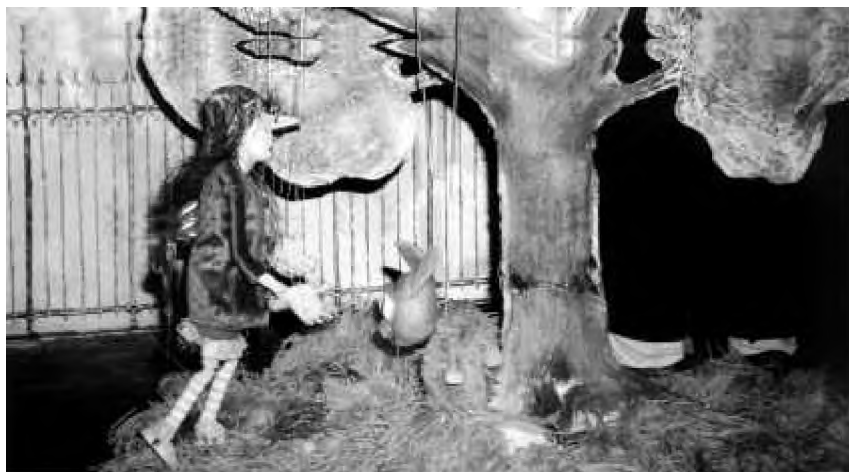
Scenă din spectacolul „Motanul Vrăjitoarei”

Rezultatul l-am văzut în recenta montare a Teatrului „Puck”, Motanul Vrăjitoarei , după Korky și Thomas, a cărui premieră a avut loc duminică, 3 decembrie 2002. Copii, părinți, bunici sînt atrași în lumea fermecată a basmului, lăsîndu-se antrenati în povestea vrăjitoarei din castelul negru, cu un motan negru care, prin vręji succesive, devine cînd verde, cînd multicolor, pentru a putea fi distins în peisaj. Aflat pentru prima dată în postura de regizor, Decebal Marin construiește o lume în miniatură, recurgînd la tehnici diverse ale artei spectacolului: translocarea din cinematografie, procedeul prin care sînt extrase din decor secvențele pentru a nu micșora păpușile și obiectele scenice; tehnica teatrului de umbre, pentru a ne aprofunda și mai mult în lumea misterioasă a basmului. Lucrul cu actorii a consti-