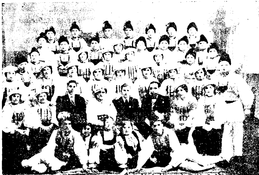
Corul din Șona, despărțământul „Astra”, Făgăraș.

arie 1938. Opt coruri din comunele Iași, Săvăstreni, Șona, Șereata, Veneția de jos, Comăna de jos, Drăguș și Feldioara s'au perândat pe scenă. Spectacolul a fost crescut și de costumele coriștilor, selecționate de ochiul priceput al d-lui Literat, președintele acestui despărțământ. Participanții la concurs și-au închetat festivalul cu un impunător ansamblu de 300 persoane. Exemplul dela Făgăraș ar trebui urmat și de alte despărțăminte.