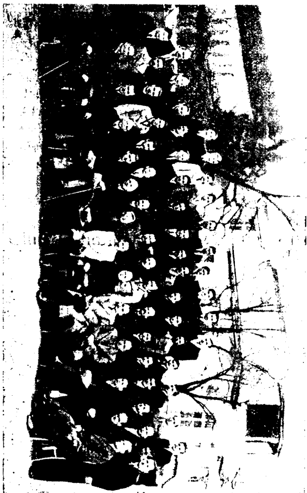
Școala pentru meseriași dela Bistrița.

Regionala Banatului a inaugurat cursuri pentru muncitori la Reșița. Regretăm că nu ni s'au comunicat amănunte asupra felului acestor cursuri.