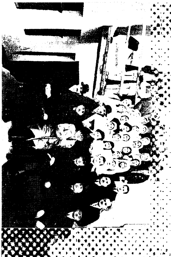
Elevele și elevii sătenii împreună cu Corpul profesoral al școlilor țărănești ale despărțământului județean „Astra“ din Miercurea-Giuc.

tip al „Astrei“, dându-se o mare importanță demonstrațiilor practice. Atât închiderea școlii pentru bărbai, cât și a celei pentru femei s'a făcut în cadre sărbătorești. Elevii și elevele au primit diplome și premii: altii și cărți.