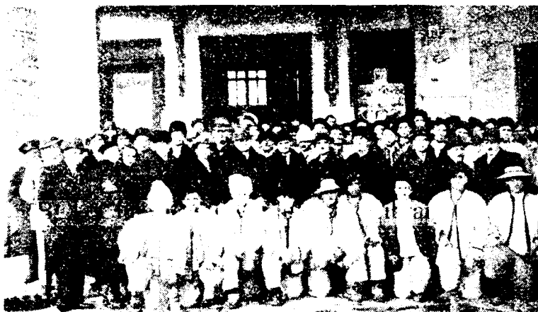
Participanții la Congresul școalei țărănești, Sighet.