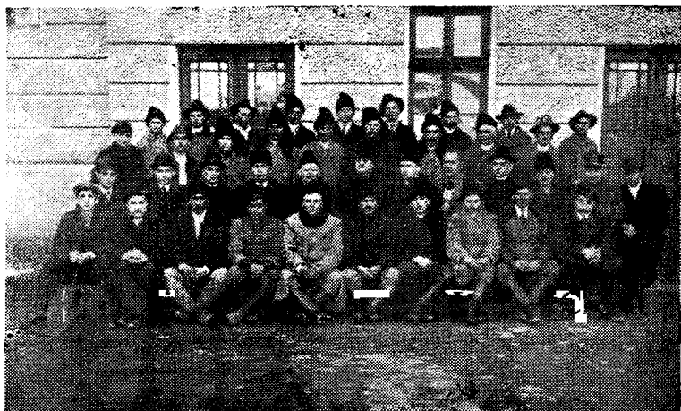
Școala țărănească din Gherla.