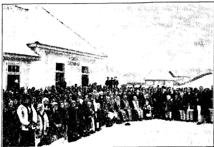
Inaugurarea „Casei culturale“ din Idicele-Pădure, la 7 Ianuarie 1934.

O frumoasă grijă s'a arătat și sănătății locuitorilor printr'o susținută propagandă de combatere a boalelor so-