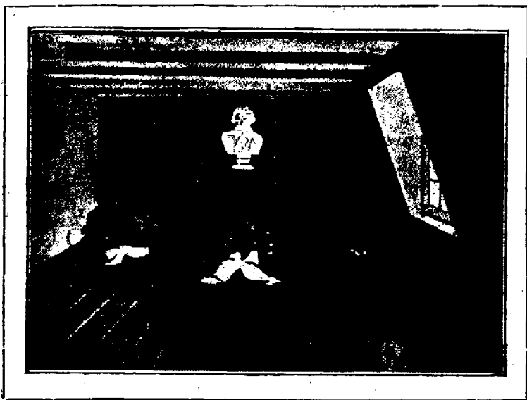
Odaia nașterii lui Beethoven, în Bonn.