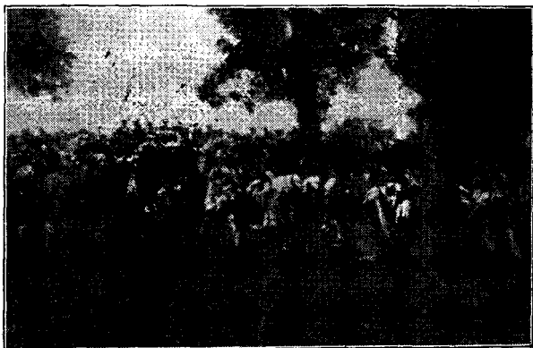
Țărănimea din Vidra în așteptarea M. Lor la casa lui Iancu.

Pe această cale în era românească viața neromânească s'a întărit în multe ținuturi cu pași uriași și nu la minoritățile băstinașe ale țării cu cari împreună împărțim bucuos pământul și bunătățile lui și cu cari voim a trăi în frățească armonie, și la bine și la rău, ci oamenii venetici din toată lumea găsesc la noi neturburați teren cald de a ne duce belșugul acolo unde le-o fi și suf etul.