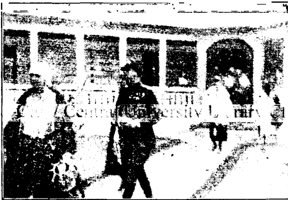
M. S. Regina și A. S. Principele Carol părăsind Biblioteca din Vidra.

Pentru a înțelege, totuși, succesul strălucit al acestor armate de legionari trebuie să pomenim faptul, ce surprinde pe oricine răscolește arhivele guvernului maghiar din timpurile acelea: unanimitatea cu care țaranul nostru s'a ridicat deodată în toate ținuturile locuite de Români. În fiecare zi Kossuth primea rapoarte dela comisarii săi despre revolta populației ro-