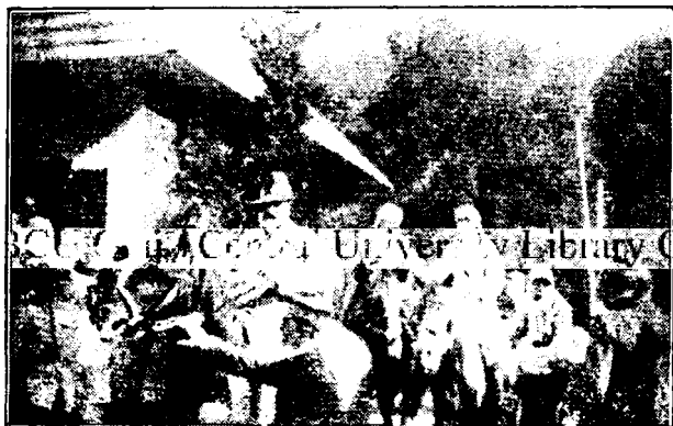
M. S. Regele în drum spre Muntele Găina.

Unii sfinți în dragostea lor mare au înebunit pentru Hristos, tot așa și Avram Iancu pentru dragostea lui de neam. Jertfele de sânge ale poporului românesc el le vede zădărnice prin intriga acelora, pentru cari se luptase. Fiu al naturii, fiu al munților, ca în general și ceilalți ardeleni, el era sincer în toate faptele sale, întocmai ca natura. El nu cunoștea meșteșugirea și prefăcătoria, ori cunoscându-le, nu voia să le urmeze. Inima lui, aprinsă de focul dragostei, nu cunoștea târguială pentru poporul său.