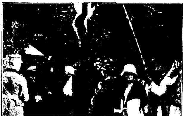
M. S. Regina în Câmpeni.

Câtă dreptate avea Eudoxie Hurmuzaki, farul luminos al fraților bucovineni, să fixeze, la sfârșitul anului 1849, următorul bilanț: «Din parte-mi, chiar deși ultima mișcare a Românilor nu ar fi avut alt spor, eu totuș aș binecuvântă apropierea duburilor, unirea inimilor, frățietatea ca-