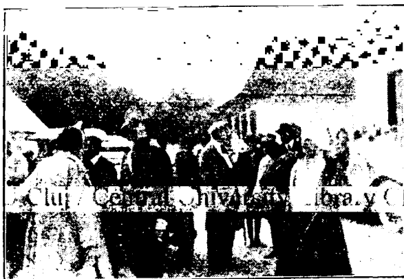
M. S. Regina în Vidra de sus.

Avram Iancu fusese ținut în curent cu fazele acestei politici până către jumătatea lui Martie, când desființarea comitetului prin învingerile generalului Bem îi luară posibilitatea de-a se mai informa. Dar și din câte cunoscuse până atunci din manifestațiile imperialilor în Ardeal și-a putut în-