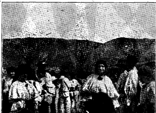
Țărani din Câmpeni în așteptarea M. Lor Regele și Regina.

Viața lui Iancu și a soților săi în munca de desrobire a fraților, va rămâne pentru toate generațiile viitoare o pildă de vecinică recunoștință.