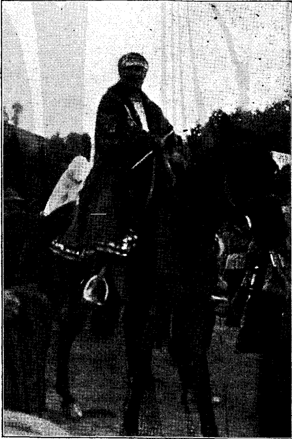
M. Sa Regina în drum spre Muntele Găina.

pe care generația de azi, a României întregite, le are și le cultivă pentru nemuritorii săi înaintași, — sentimente, pe cari, ținând să le mai mărturisească odată guvernul țării, prin glasul meu, salută cu respect umbra glorioasă a marelui erou și se închină cu pietate mormântului său, preamă-