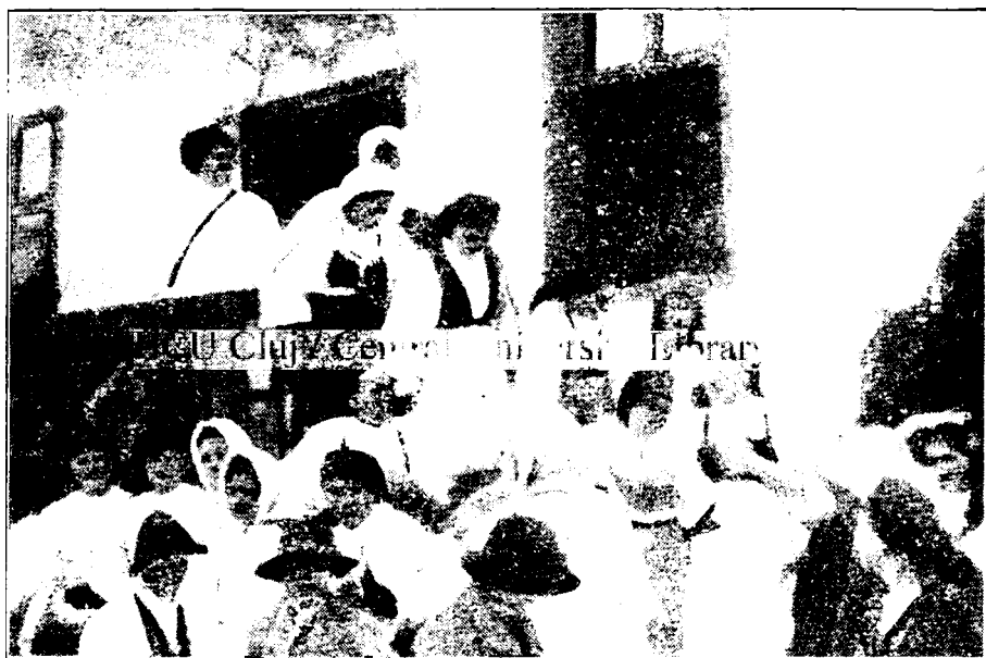
Țaranii din Vidra de sus în așteptarea M. Lor. Regele și Regina.

Alătura de Liga culturală, căreia după realizarea idealului național pentru care a dus lupte așa de memorabile, marele nostru învățat și istoric, care a condus-o cu atâta râvnă, a dat îndrumări noi menite să ducă la înfrățirea sufletelor prin cultură, alătura de fundațiunea culturală înființată de iubitul nostru fiu, puteți pași mână în mână la deștelenirea ogorului nostru cultural și la ridicarea națiunii prin cultură.