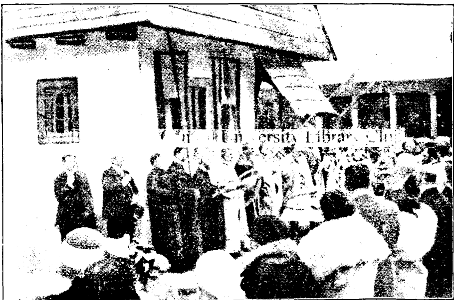
Serviciul divin înaintea casei lui Iancu.

La ora 14 a plecat partea cea mai mare de oaspeți, cu automobilele, spre Câmpeni. În toate satele pe unde au trecut MM. LL. s'au ridicat porți triumfale și au ieșit satele, cu mic cu mare, întru întâmpinarea iubiților suverani. Membrii familiei regale s'au oprit la Brad și Abrud pentru câteva momente, ca să primească omagiile populației. A. S. R. Principele Carol.