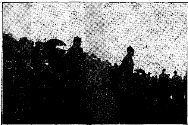
M. S. Regele pe Muntele Găina.

Amândouă figurile trecute în mitologia populară se găsesc într'o perfectă înrudire organică. Au pornit și unul și altul dela aceeași vatră țărănească, au crescut în aceleași patimi și au încarnat aceleași năzuinți ancestrale. Lupta lor s'a desfășurat pe un fond comun, având un obiectiv unic și mijloace la fel. Concepția politică de care s'au călăuzit și care a determinat prăbușirea lor tragică a fost aceeaș iluzie deșartă a împăratului dela Viena, cea mai tristă și cea mai scump plătită erezie a ideologiei noastre de veacuri. Ce-i desparte însă pe cei doi martiri ai Moșilor, e cadrul vremii în care s'a deslănțuit epepeia lor, cortegiul de loziuce și de evenimente, care i-au întovărășit pe câmpul de bătaie. Horia e revoluțio