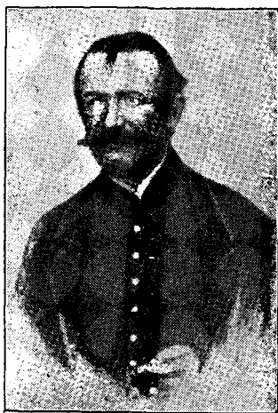
Portret necunoscut al lui Avram Iancu, din epoca din urmă.

În jurul mormântului lui Iancu s'au exhumat toți morții, lăsându-se un loc liber, de jur-împrejur, de 600 m 2 . De-a dreapta mormântului se află bătrânul «gorun al lui Horia», iar de-a stânga un teren de 800 m 2 , unde zac cei doi colaboratori ai lui Iancu, prefectul I. Buteanu și tribunul Simeon Groza, ale căror oseminte s'au adus din prilejul acesta. Și Butean și Groza au câte o cruce frumoasă la căpătâi.