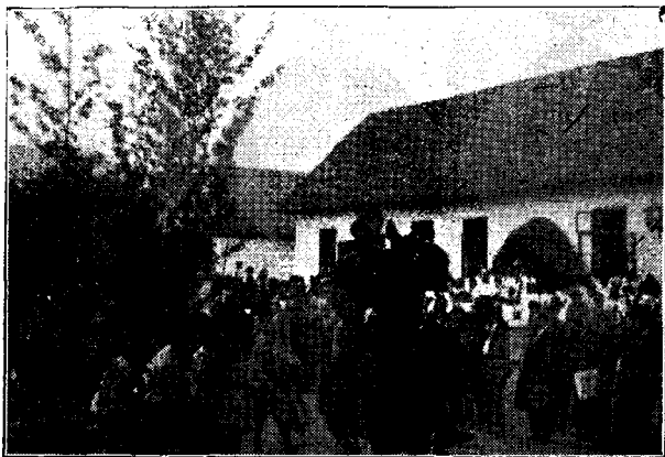
A. S. Principele Carol în drum spre Muntele Găina.

Avram Iancu a fost îngropat nu la Cluj, nu la Sibiu sau Alba-Iulia, unde trăiau cei dela conducerea țării, ci la Tebea — un sătășor mic românesc... În aceasta vedem semnul, care ne arată că Avram Iancu prin activitatea lui nu căută mărire, ci numai binele norodului din care făcea parte... și precum când eră student nu se amestecă cu fiil de baroni și magnați, ci petrecea numai cu Românașii săi... așa și a rămas credincios Moșilor, pân' la sfârșitul vieții. Și Regele nostru Ferdinand, unind sub sceptrul Său pe toți Românii, a fost numit de basarabeni Regele Țăranilor, cu cari a biruit și a dobândit libertatea, pentru cari a luptat și Avram Iancu, Regele Moșilor.