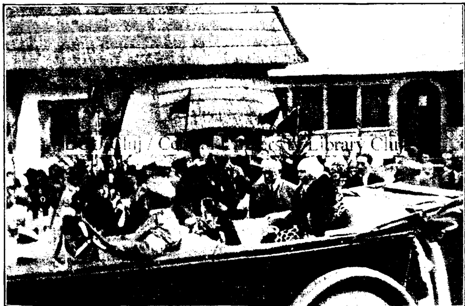
Plecarea M. Lor Regele și Regina dela casa lui Iancu.

«Cu înaltă însuflețire am venit împreună cu familia Mea spre a ne închină împrejurul legendarului gorun al lui Horia, la mormântul lui Avram Iancu, marele lup- tător pentru drepturile naționale.»