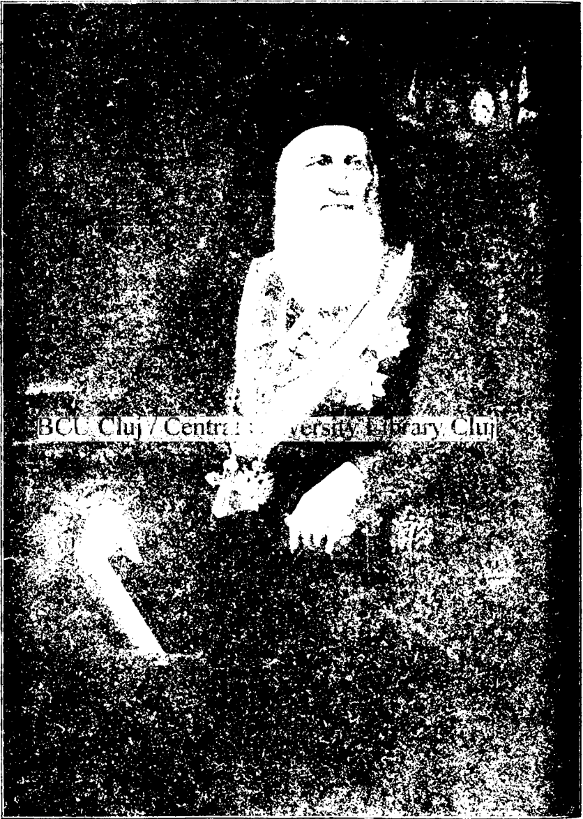
Andreiu Șaguna, întâiul președinte al „Asociațiunii“.