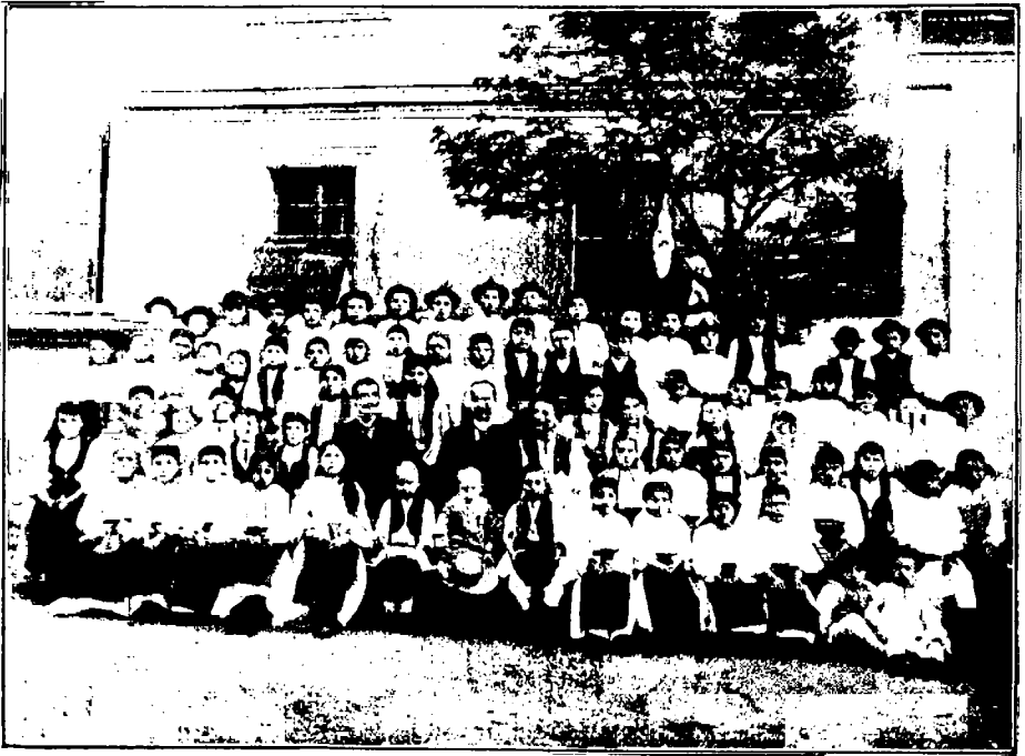
Elevii școlii din Tilișca în mijloc cu corpul didactic, fotografiați în anul 1904.

În forma aceasta s'au ținut în anul școlar 1869/70 10 ședințe, una mai interesantă ca cealaltă.