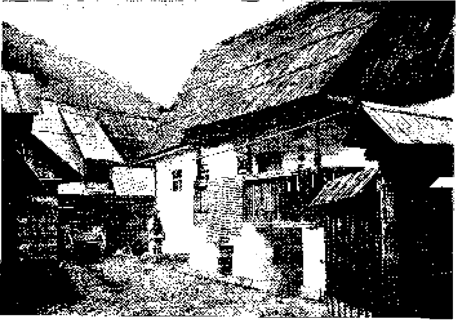
Fig. a) Casă din Rășinari (fața dinspre curte).