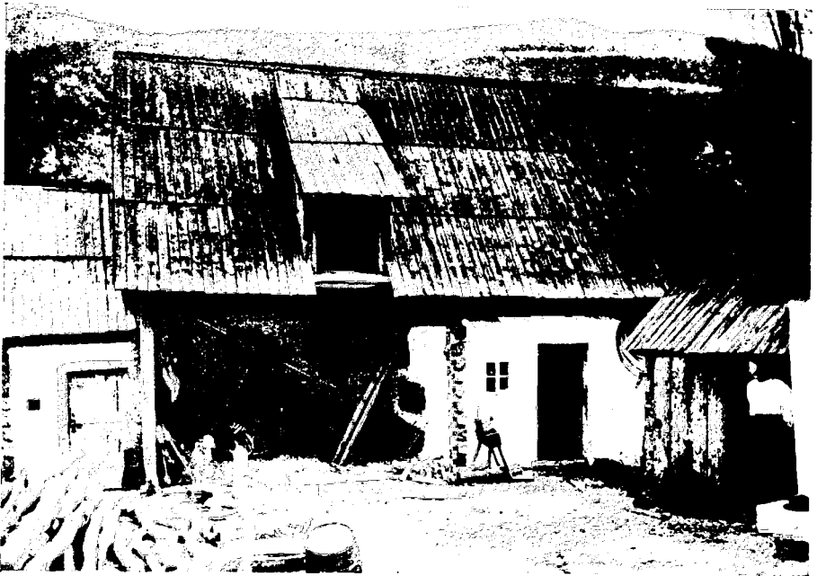
Fig. b) Șura cu grajdul și celarul.