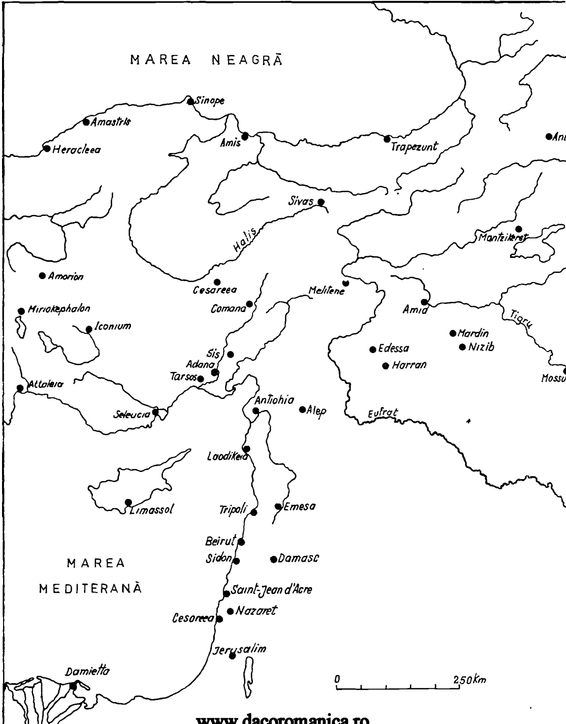
Fig. 1. Harta Orientului Apropiat în timpul lui Mihail Sirianul.