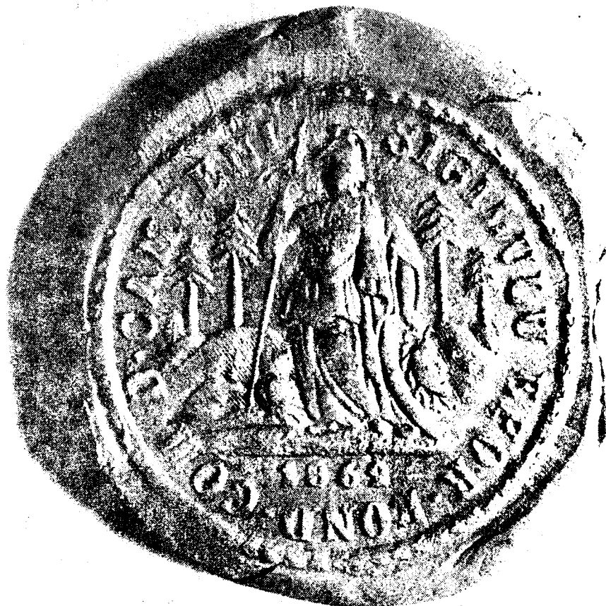
Fig. 1. Sigiliul Eforiei Fundației comunei Cîmpeni.

Metaforă plastică, evocînd viața locuitorilor din Țara moșilor, amintind caracterul așezărilor durate aici, casele înrădăcinate în piatra muntelui, și oamenii locului ce s-au asemănat cu arborii al căror trunchi se dezvoltă în ambele sensuri respectiv pe de o parte își înalță coroană