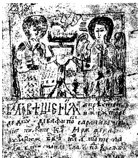
Fig. 4. — Vat. Rom. 6; fo. 244 r