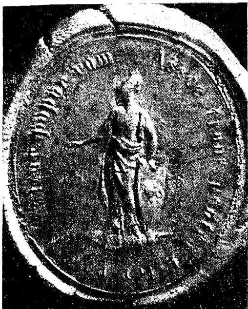
Fig. 1. — Impresiune obținută prin aplicarea în ceară a matricei ASTREI.