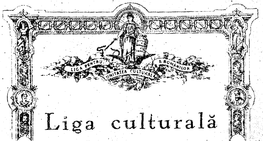
Fig. 3. — Antetul cărții de membru al LIGII CULTURALE”.