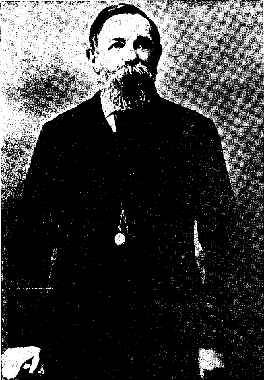
Fig. 1. Friedrich Engels in 1891.