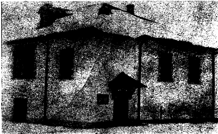
Fig. 2. — „Mănăstirea” Drăgășanilor (Casa Episcopiei Rîmniceului).

În 1911 se găsea aici reședința Regiunii Viticole Drăgășani. La 25 noiembrie 1911, statul vînduse Ministerului Instrucțiunii Publice imobilul — fosta casă a episcopiei — cu 14 000 de