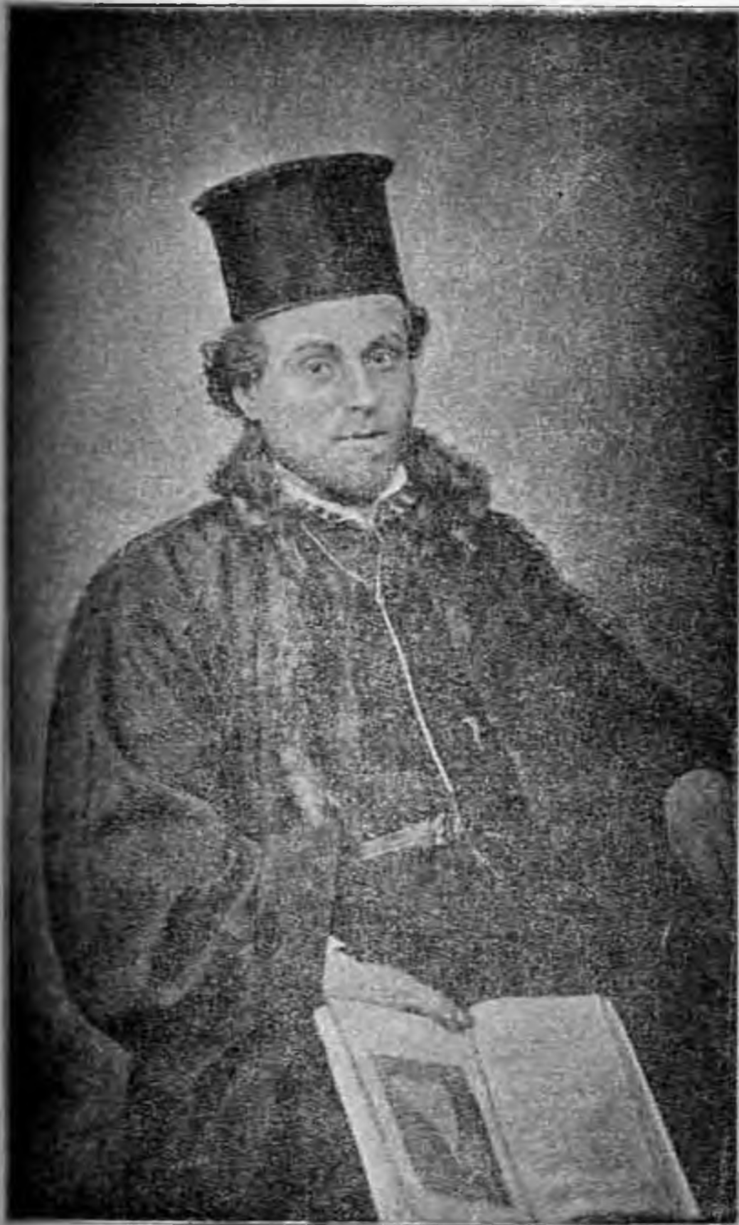
Ion Creangă, Diacon

Foto făcut cu chelluiala Societății Studentești „Carmen Sylva” din Iași.