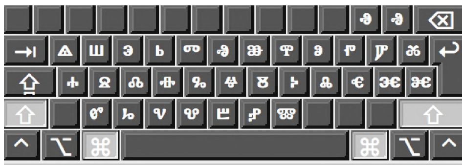
Tastatura autorului pentru glagolitic, forma finală