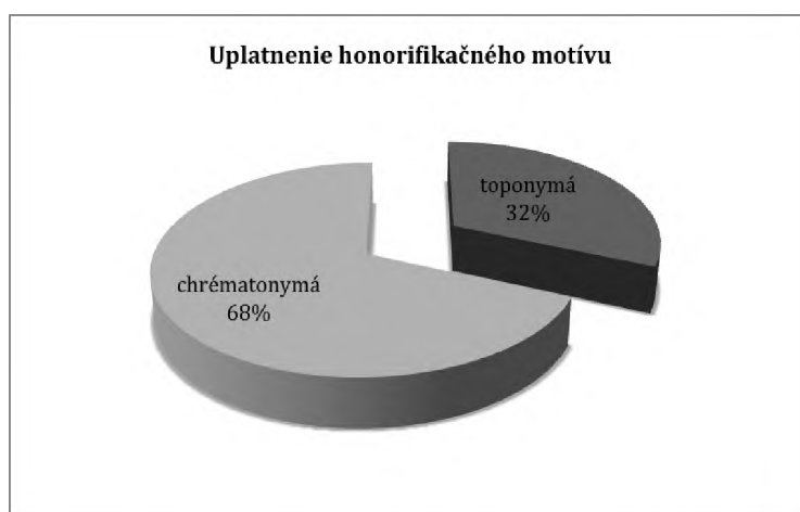
Graf 1 Glorifikovanie cyrilometodskej tradície na pozadí vlastných mien

Z grafu je zrejmé, že cyrilometodská tradícia sa vo výberovom materiáli odzrkadľuje priamou dedikáciou v dvoch základných druhoch vlastných mien, a to na pozadí toponým a chrématoným. Z celého korpusu proprií glorifikuje solúnskych bratov Cyrila a Metoda 32% toponým. Táto skupina vlastných mien je jednoliata, pretože je zastúpená výhradne urbanonymami. Naopak, druhá skupina je rôznorodá, pestro členitá a predstavuje 68% zastúpenie chrématoným z celkového počtu honorifikačných vlastných mien.