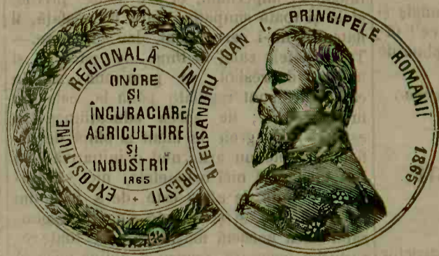
MEDALIE DE LA EXPOSITIA DIN BUCUREȘTI