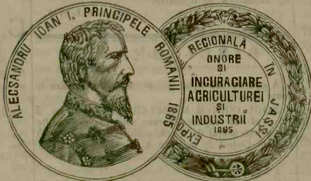
MEDALIE DE LA EXPOSITIA DIN IAȘI