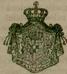
— FONDATA IN ANUL 1865 —