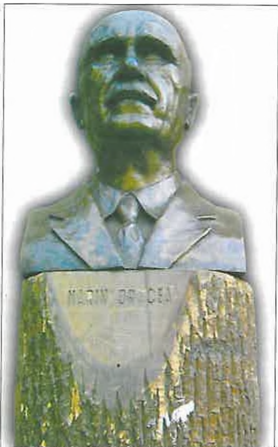
Foto 3. Bustul lui Marin Drăcea aflat la Institutul de Cercetări și Amenajări Silvice, operă a profesorului Emil Negulescu.

Sugestivă este afirmația potrivit căreia „se judecă economia forestieră după înălțimea soarelui, după latitudine, după sol și după climă și se ignoră faptul că cel mai puternic factor care hotărăște soarta pădurii este omul, care foarte multă vreme a fost ignorat, dar cu toate acestea, secole întregi a continuat să submineze economia forestieră și pădurea. Și atunci apare acest mare adevăr, că centrul de pre-