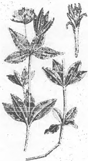
Fig. 1. Asperula taurina L. habitus și floare mărită