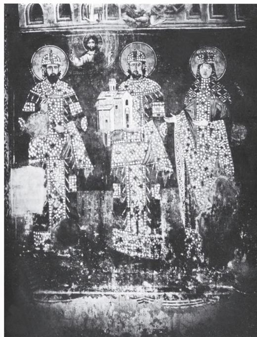
Portraits of Milutin (on the left), Dragutin and Catherine in the Church of St. Achillius in Arilje, 1296

Milutin evidently decided to officially recognize Nogai's overlordship. Sending of his son and aristocracy as hostages, and possibly military support, was a usual practice in relations between principalities of Rus' and Mongols 37 , and also in Nogai's relations with Bulgaria, as evidenced in the example of Theodore Svetoslav. Likewise, Milutin abandoned his recent conquests. Only in the context of this agreement, his leniency towards prince of Vidin, readiness to return him all his possessions and the marital bond between Šišman and daughter of high ranking Serbian official can be understood. Obviously, accord between Milutin and Šišman was related to the agreement between Serbian king and Nogai; it came simultaneously or as its consequence 38 . Maybe these new political circumstances also had some weight in Milutin's decision to drive away his Hungarian wife, and maybe their separation was a result of other factors, possibly pressure of the Serbian Orthodox Church. At any rate, in the church of St. Achillius in Arilje, situated on Dragutin's territory, there is a fresco