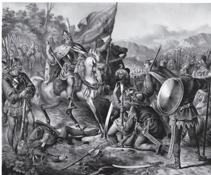
Victory of King Milutin over the Tatars, Lithograph of Anastas Jovanović (1852)

The conflict between Dorman and Kudelin on one side, and Dragutin on the other, escalated in the following years. Danilo notes that since Dragutin had received Mačva, “not much time has passed” when he decided to attack lords of Braničevo. His attempt was no more successful than Sovari’s in 1284 and “since this country [Braničevo] was very fortified, he could not do them any harm, or drive them out from their lands, so he returned to his state”. Shortly after, with the help of Tatar and Cuman mercenaries from the left bank of the Danube, who “were paid in gold”, Dorman and Kudelin have taken an incursion into Dragutin’s lands and conquered “many parts of his country”. In fact, Dragutin was forced to flee from his lands, or as Danilo reports: “King Stephen [Dragutin], seeing himself in such misery and unable to do anything else went to his lovely brother king Stephen Uroš [Milutin]” 27 . The scale of the operations and force the lords of Braničevo had at their disposal is further illustrated by the fact that Cumans under their command sacked the old ecclesiastical seat of Serbian archbishopric – Monastery of Žiča, situated at the territory of Milutin, near the confluence of Ibar river and Western Morava 28 . As Dragutin supported him during the war against Byzantium, Milutin was probably obliged to return the help to his