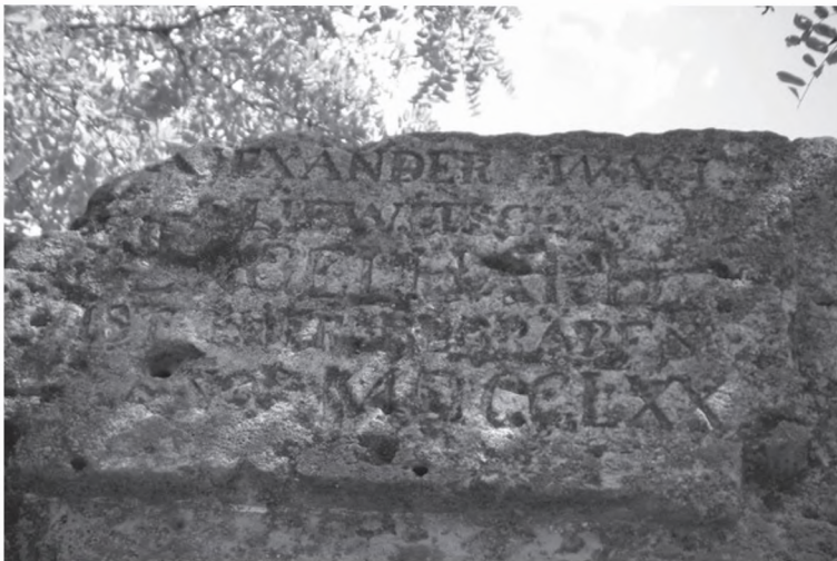
Monumentul de la Valea Mărului

O serie de operațiuni militare ale războiului ruso-otoman din anii 1768-1774 s-au desfășurat în zona Văii Gerului, unde este amplasată geografic și comuna Valea Mărului. Comuna Valea Mărului este atestată documentar cu numele Puțeni la data de 4 martie 1533 7 . Era o moșie răzășească în ținutul Covurlui, ocolul Mijlocului. Catagrafia din anul 1774 precizează și ea că satul Puțeni aparținea județului Covurlui și făcea parte din ocolul Mijlocului, alături de Pechea, Oasele, Băleni și alte localități 8 .