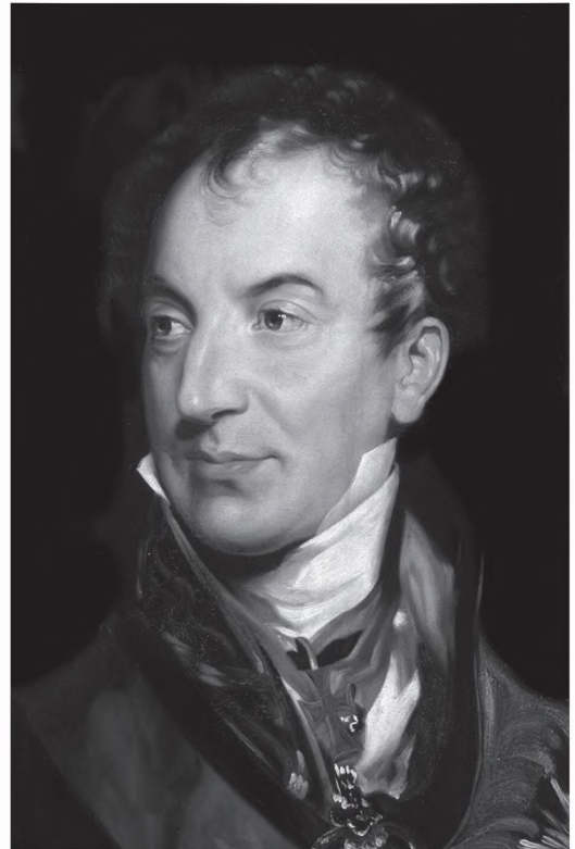
Klemens von Metternich

Divergențele ruso-persane au fost prilejuit de delimitarea liniei de frontieră care trecea