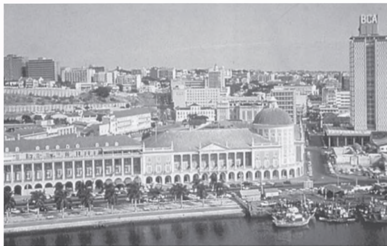
▪ Vedere parțială a impunătorului edificiu al „Bancos de Angola e Comercial” – 1970