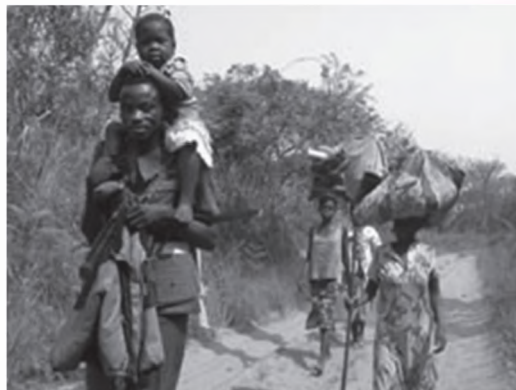
▪ Grup de copii în zona Kuito, refugiați în apropierea frontierei Namibiei