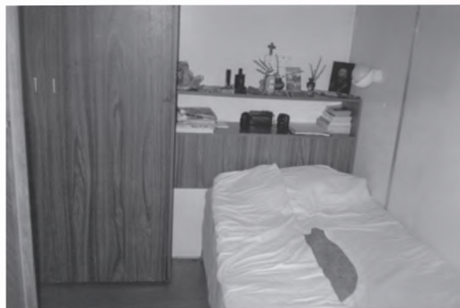
■ Camera mea dormitor

– Zona Operativă , care includea clădirea SRSG și DSASG, Componenta civilă cu staful ONU, Componenta Militară cu Comandamentul Forței și