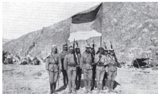
▪ Soldați din Armata Arabă în timpul Revoltei Arabe din 1916-1918

Situația a cunoscut o relativă îmbunătățire în urma Declarației președintelui Statelor Unite,