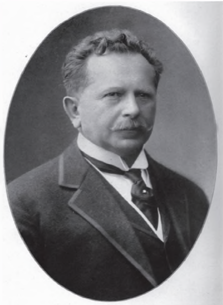
▪ Charles Vopicka

american, controlat în ultimii ani de republicani, dar și în același timp pentru a-l recompensa pe businessman pentru sprijinul oferit atâția ani, la recomandat pe Vopicka secretarului de stat W.J. Bryan pentru a fi nominalizat ca ministru plenipotențiar în cele trei capitale, București, Sofia și Belgrad. În ciuda faptului că prezența în corpul diplomatic a unui fabricant de bere și lichioruri – acestea erau afacerile sale – a generat proteste vehemente din partea unor organizații civice antialcoolice și a rezervei condescendente a secretarului de stat în fața acestei realități, președintele și-a impus punctul de vedere și, la 11 septembrie 1913, Charles Vopicka a fost nominalizat oficial în funcția de trimis extraordinar și ministru plenipotențiar al S.U.A. în România, Serbia și Bulgaria, cu reședința la București 3 . A fost unica misiune diplomatică a unui om care nu avea absolut nici cea mai mică tangență cu diplomația. Misiune îndeplinită cu succes vreme de șapte ani – mai exact până la 9 decembrie 1920, când ministrul plenipotențiar și-a prezentat demisia, „din considerente personale.... de sănătate și de afaceri ale familiei” 4 – în trei state care vor deveni în scurt timp rivale, înfruntându-se chiar armat, în niște vremuri tulburi și sângeroase, marcate de derularea Primului Război Mondial.