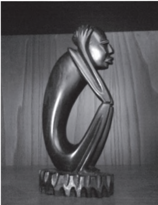
▪ O Pensador

• Din cauze ușor de anticipat, cam prin martie 1996, unul dintre colegi a făcut un șoc psihic. Nu știu și nici nu am căderea să apreciez dacă a fost din cauza alimentației pur vegetariene la care acesta trecuse de mai multe luni, din cauza stresului specific funcției sale, a atacului la care mașinile