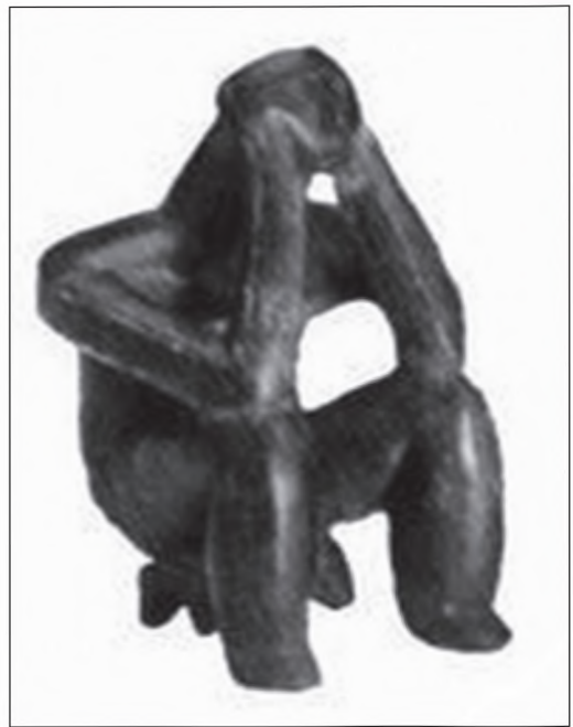
▪ Gânditorul de la Hamangia