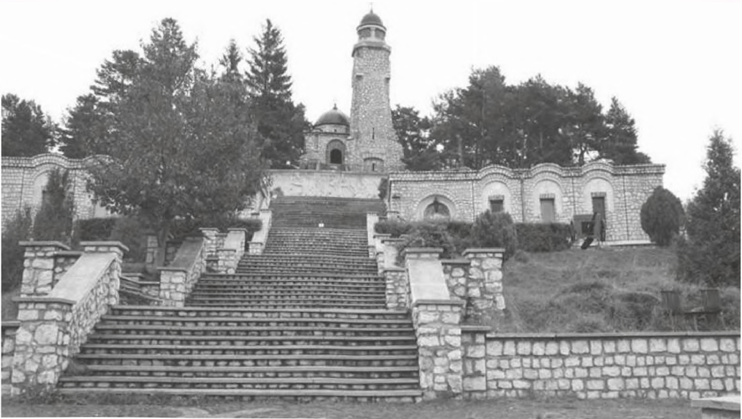
■ Mausoleum of Mateias

gram focused on reconstructing the national symbols but also on observing the humanitarian international law.