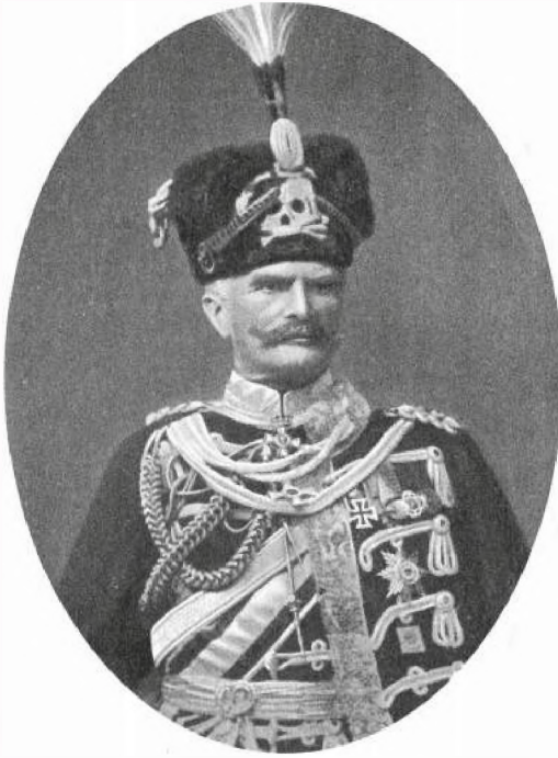
■ Generalfeldmarschall August von Mackensen

fensive brach aber nach wenigen Tagen, nicht zuletzt wegen widriger Witterungsbedingungen, unter ungeheuren russischen Verlusten zusammen. Vereinzelt russische Geländegewinne eroberte die 10. Armee durch Gegenangriffe sofort zurück 52 . Die Abwehr der russischen Offensive ohne größere Schwierigkeiten verstärkte in der OHL fälschlicherweise den Eindruck die für Sommer 1916 erwarteten russischen Angriffe, ohne größere Schwierigkeiten abwehren zu können. Auf italienisches Drängen begannen die Russen unter General Aleksej Brussilow, mit nur geringer materieller und personeller Überlegenheit dafür aber mit einer modernisierten Infanterie- und Artillerietaktik 53 am 4. Juni 1916 südlich der Pripjetsümpfe mit einer Großoffensive auf breiter Front gegen die österreich-ungarischen Verbände 54 . Innerhalb weniger Tage hatten die russische 8. und 9. Armee die 4. und 7. k.u.k. Armee völlig zerschlagen. Bis zum 12. Juni hatten die Russen über 200.000 Gefangene, mit Masse k.u.k. Soldaten, gemacht und über 200 Geschütze erobert.