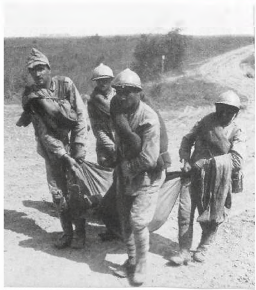
▪ Romanian prisoners carrying an injured companion

More prisoners appear later on. Hundreds of them. Among them, one young lieutenant – a nice fellow. He speaks a bit of German. His wife wrote him that zeppelins are flying over Bucharest every night, the capital is burning and the rich started to leave the city. His regiment was a so-called regiment of frontier guards. Asked what chances he thinks his country has to victory, he raises his shoulders in a not-so French attitude: «If Germany starts seriously against us...» He is interrupted by a bizarre creature, a civilian taken prisoner. A merchant who presents itself as the «intendant» of the battalion. Dressed as a civilian? Surely, that’s some-