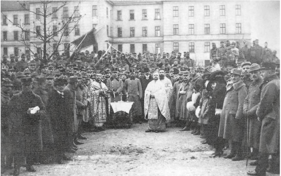
■ November 1/14, 1918. The Hallow of the first Romanian Flag in Vienna, in the presence of Romanian officers and soldiers

But Romanian regiments retained their cohesion, which enabled them to support the Czechs,