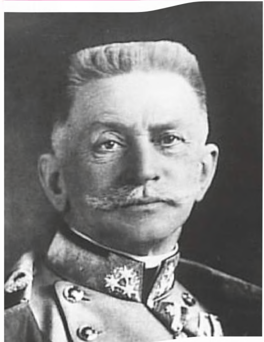
■ Feldmarschall Conrad von Hötzendorf, der Chef des k.u.k. Generalstabs

Militärisch war den Russen eine schwere Niederlage zugefügt und die russische Dampfwalze gestoppt worden. Der Sieg hat jedoch tiefergehende langfristige mentalitätsgeschichtliche und strategische Dimensionen. So wurde das schon vor Kriegsbeginn latent vorhandene Überlegenheitsgefühl der deutschen Soldaten und ihre Führung gegenüber den russischen Soldaten und deren Führung bestätigt und wirkte bis in den Zweiten Weltkrieg nach. Gleichzeitig verdeckte der operative Triumph die mit ihm untrennbar verbundene strategische Niederlage des Kaiserreiches. Denn die drohende Katastrophe im Osten vor Augen, hatte Moltke zwei Armeekorps des rechten Flügels von der West- an die Ostfront