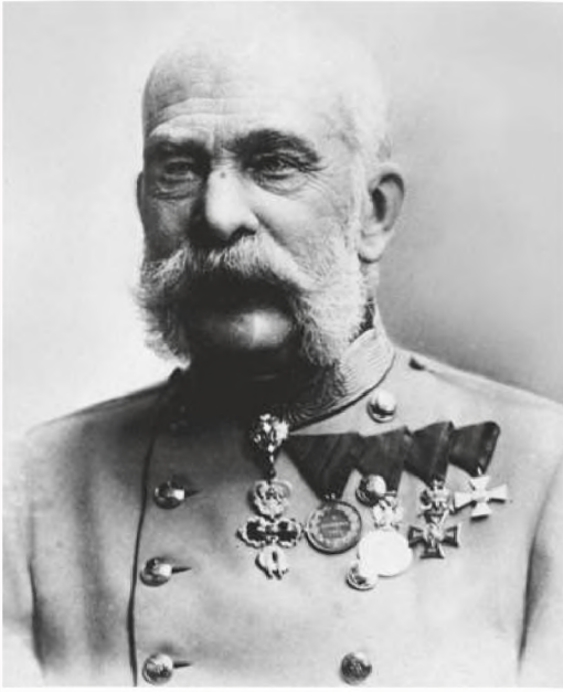
▪ The Emperor Franz Josef

ally a rift was created between the officers and the soldiers, due to the suspicion and resentment which the officers, particularly those in reserve, could not control any longer.