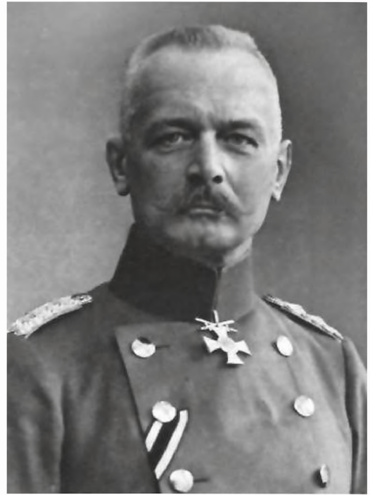
▪ General Erich von Falkenhayn

Der Sieg über Serbien öffnete nun die Versorgungslinie in die Türkei und trug wesentlich zur