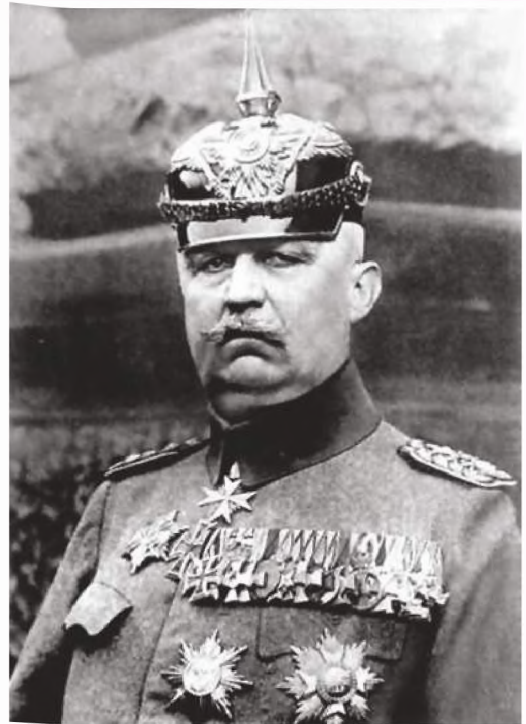
■ General Erich Ludendorff

Dieser Strategiestreit zwischen „Westlern“ und „Ostlern“, der sich immer wieder an der Verwendung der wenigen operativen Reserven entzündete, führte zu der militärischen Führungskrise des Winters 1914/1915, die in dem Versuch Hindenburgs und Ludendorffs gipfelte, Falkenhayn abzulösen 31 . Wilhelm II. lehnte dies jedoch kategorisch ab. Falkenhayns Entschluss die neugebildeten Reservekorps OberOst für eine Offensive in Ostpreußen zur Verfügung zu stellen, entspannte die Lage nur vordergründig. An den unterschiedlichen Grundsatzpositionen änderte sich nichts, denn Falkenhayn glaubte im Gegensatz zu OberOst weiterhin nicht an einen kriegsentscheidenden Sieg gegen Russland, sondern erwartete nur „größere örtliche Erfolge“. Nachdem mit neu aufgestellten Reservekorps die zwischenzeitlich erneut in Ostpreußen eingedrungene russische 10. Armee in der Winterschlacht in den Masuren geschlagen worden war, gingen auch im Osten die Truppen zum Stellungskrieg über 32 . Der von OberOst angekündigte große operative Erfolg war jedoch erneut ausgeblieben und die Heeresreserve zu Gunsten eines taktischen Erfolges gebunden worden. Falkenhayn sah sich in seiner Überzeugung bestätigt, dass Russland militärisch nicht vollständig zu bezwingen sei. Diese Erkenntnis teilte nun auch Hoffmann: „Vollständig niederzuwerfen ist das russische Heer nicht, das könnten wir nur, wenn wir eben nur mit Russland allein Krieg führten.“ 33 Trotz aller Erfolge im Osten ließ