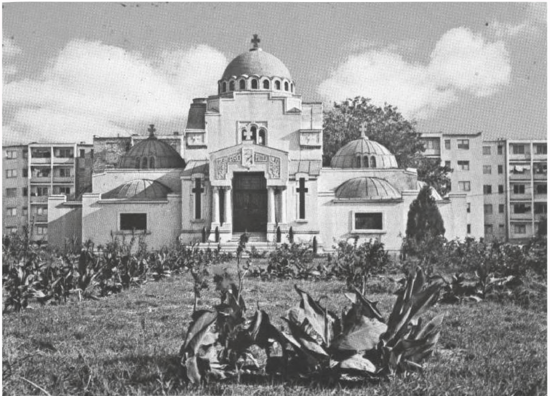
■ Mausoleum of Focșani

After 1948, the institution the Heroes' Cult has been closed down, the decorative element which did not correspond to the communist regime were removed from the monuments (the coat of arms and the royal insignia, inscriptions, etc), the liberator soviet soldier becoming, for many years on, the only who was to be commemorated. After 1990 a genuine rebirth of respect for those dead in war took place, the setting up of the National Office for Heroes' Cult (2004) being an important decision of the Romanian state within the wider pro-