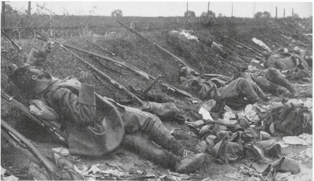
■ Romanian soldiers, victims of the battle on the railway, near Braşov