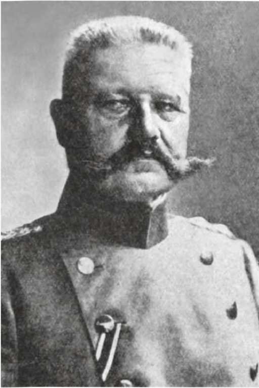
■ Generalfeldmarschall Paul von Hindenburg

So marschierte die 8. Armee, nach Eintreffen der Verstärkungen aus dem Westen, gegen die Njemen-Armee auf und griff diese am 7. September an. Obwohl die Offensive zu keinem durchschlagenden Erfolg führte, brach Rennenkampf aus Furcht vor einer Umfassung die Schlacht ab und wich unter Verlust von 45.000 Soldaten sowie über 200 Geschützen hinter den Njemen zurück 22 . Damit war die Gefahr für Ostpreußen vorerst gebannt und die 8. Armee in Teilen für weitere Operationen verfügbar.