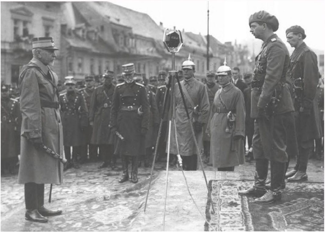
▪ Le roi Charles II confère en 1930 le bâton de maréchal à Constantin Prezan et à Alexandru Averescu

pas confirmer les propos de Prezan, mais, chose aussi importante, ils n'étaient plus en état de les infirmer ou de les corriger.