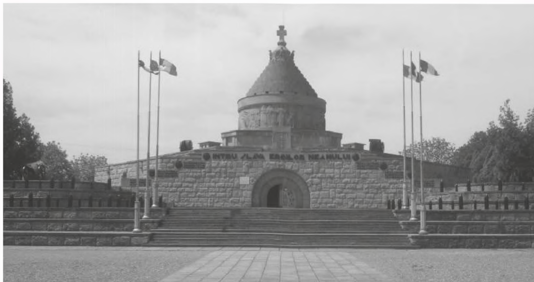
■ Mausoleum of Mărășești

The war, as a phenomenon, has considerably influenced the society and the people's mentality who have started to become citizens, aware of their