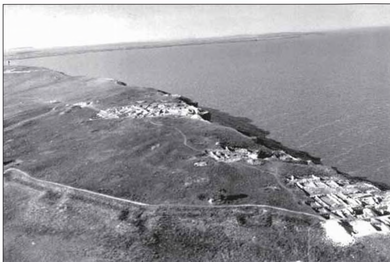
• Vedere aeriană a așezării antice Capul Dolojmar (Orgame/Argamum)

acesteia Ptolemeu însemna: Durostorum, Transmarisca, Sucidava, Axiopolis – în aval de care marele fluviu purta numele de Istros – Carsium, Troesmis, Dinogetia, Noviodunum, Sitioenta/Aigysoenta, în fapt Aegyssus. Încă de la cetatea Noviodunum Istrul își despărțea apele, vărsându-se în Pontul Euxin prin mai multe guri numite de la nord spre sud: Thiagola sau Pylon, Boreion, Naracion, Pseudostomos, Kalon, Peuce sau Sacră. După această gură urma un promontoriu, Pteron, apoi cetățile Istros, Tomi, Callatis, Dionysopolis, promontoriul Tiristis, Odessos și, dincolo de gurile fluviului Panysos, Mesembria. La nord de delta Istrului Îndreptarul geografic enumeră orașul Harpis/Carpis, satul lui Hermonact, orașul Tyras de la gurile fluviului omonim, Ophiussa și Niconium 10 , ultimul, probabil o colonie a Istrosului, după multitudinea de monede istriene și tipul de rămășițe de ceramică descoperite.