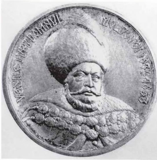
• Vasile Lupu, domn al Moldovei (1634-1653)