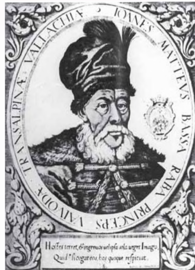
• Matei Basarab, domn al Țării Românești (1632-1654)

și poezilor. Astfel, influența grecească în Țara Românească și Moldova a fost atât politică, cât și culturală și, bineînțeles, economică.