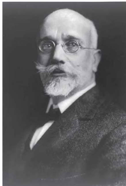
• Eleftherios Venizelos

Practic, în timpul reuniunii s-au evidențiat două teze fundamentale, în jurul cărora s-au purtat toate discuțiile – cea engleză, care venea în întâmpinarea doleanțelor românești și cea sovietică, susținută de Turcia, ce preconiza închiderea Strâmtoarelor. Teza britanică, susținută cu multă abilitate de lordul Curzon, șeful delegației și președinte al Comisiei speciale pentru chestiuni teritoriale, viza demilitarizarea și libertatea Strâmtoarelor, de așa natură încât accesul neriveranilor să nu fie îngrădit. Poziția Uniunii Sovietice urmărea menținerea hegemoniei în Marea Neagră, în spatele