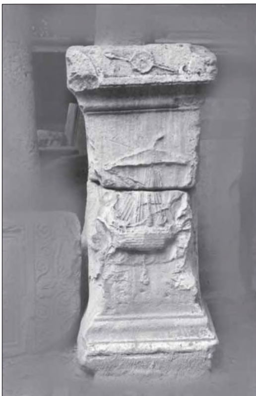
• O nav` antic` de pe o inscrip]ie de la Histria (Istros)

doua jumătate a secolului VII î.Hr. ceea ce își află și susținerea arheologică, prin fragmente ceramice ale unor vase ionice de import 14 .