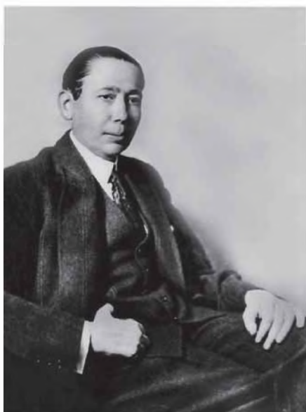
• Nicolae Titulescu

Problematica Mării Negre a făcut mai ales obiectul de interes al Turciei și României, țări riverane, Grecia fiind interesată mai ales de situația din Marea Mediterană, acolo unde avea de înfruntat tendințele de