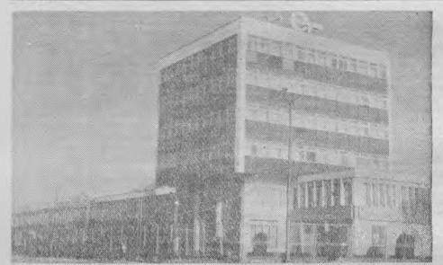
O colitură a prezentului socialist: Întreprinderea Electrotimis.