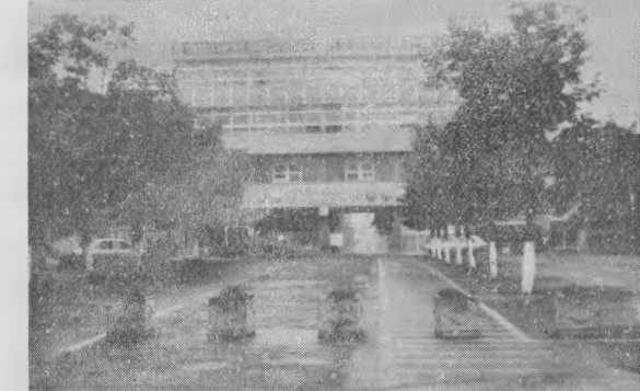
Pe aici pătrund, zi de zi, mii de oameni al muncii, în puternicul bastion al industriei constructoare de mașini timișorene.