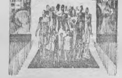
Deven de XENA ERA CLAUDE VREM

Deven de XENA ERA CLAUDE VREM... (Text continues with a detailed account of military actions and personnel)