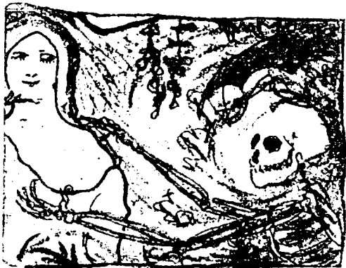
Desen de Adrian Maniu