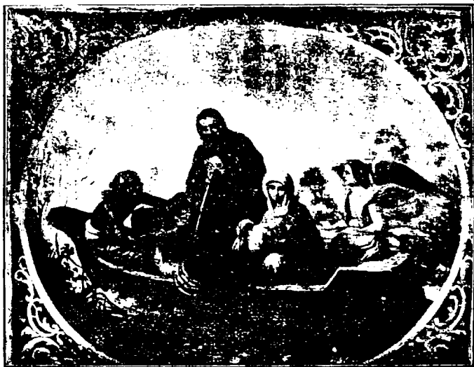
Fuga lui Iosef în Egipt. Icoană zugrăvită de pictorul N. Grigorescu

Mai sânt apoi monete vechi, dar pe toate le-a șters vremea, deabiă se mai deslușesc pe unele, chipul bărbos al lui Decebal și fruntea încrețită a Împăratului Traian.