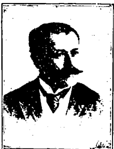
I. L. CARAGIALE