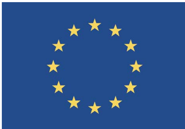
Simbolul Uniunii Europene, color

Se recomandă plasarea siglei pe un fundal alb. Dacă totuși se folosește un fundal multicolor, sigla va avea un contur alb cu grosimea egală cu 1/25 din înălțimea dreptunghiului.